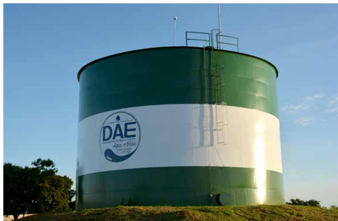
Reforma de todos os reservatórios de água da cidade, com nova pintura e reparos necessários

Sempre utilizando de recursos próprios, o DAE buscou realizar importantes obras e investiu pesadamente na aquisição de equipamentos e produtos essenciais para o seu perfeito funcionamento. Destaca-se nestes itens, a manutenção do estoque de peças e equipamento do almoxarifado, onde a preocupação sempre foi de manter uma quantidade estável de todos os produtos consumidos no