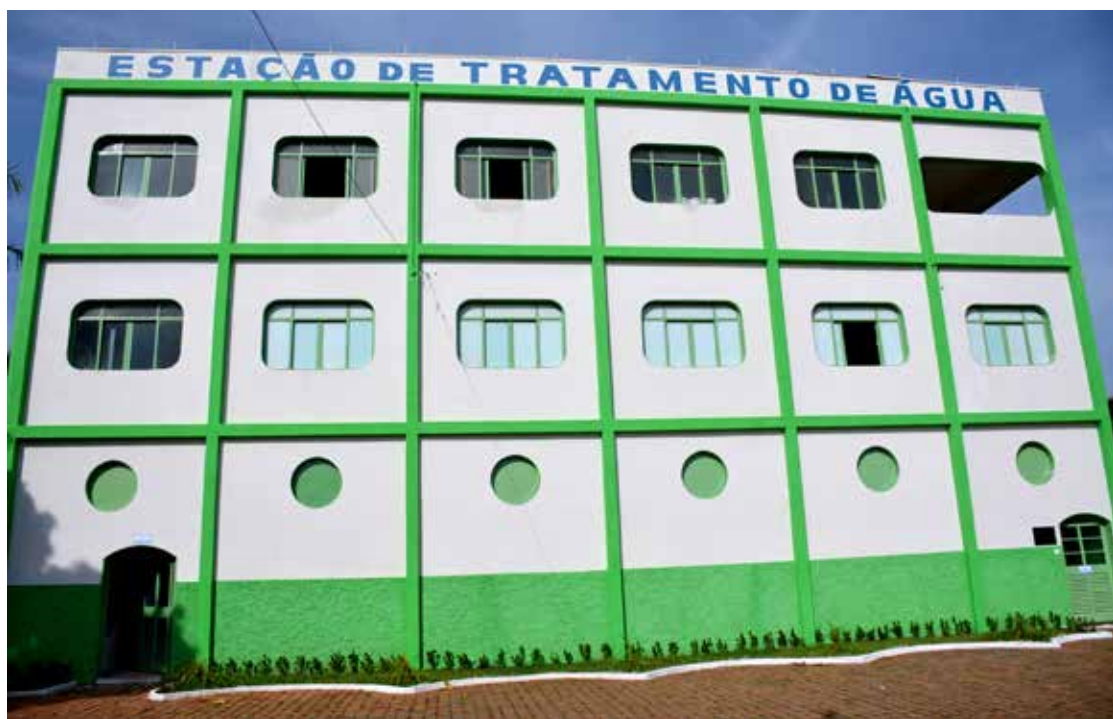
Foi realizada uma completa reforma em todas as instalações da Estação de Tratamento de Água

departamento e na rede de captação e distribuição de água. Aquisições importantes se destacaram como a compra de duas picapes Fiat Strada, aquisição de motor potente e com capacidade para melhorar a captação de água na Represa dos Buritis e conduzi-la até a estação de tratamento; aquisição do prédio que hoje abriga as instalações do DAE, pelo valor de R$ 350.000,00 (recurso próprio), destacando, ainda a completa reforma das instalações do Estação de Tratamento de Água – ETA e de todos os reservatórios