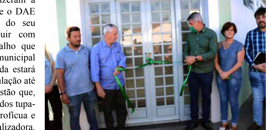
De Assis e o prefeito realizando o desenlace da fita inaugural