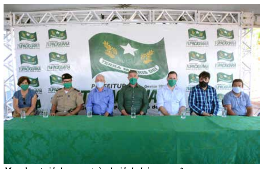
Mesa de autoridades presente à solenidade de inauguração

Logo após as homenagens feitas ao diretor do DAE e ao prefeito, bem como ao descerramento da placa inaugural das obras, todos os presentes foram convidados a visitar as novas dependências do DAE.