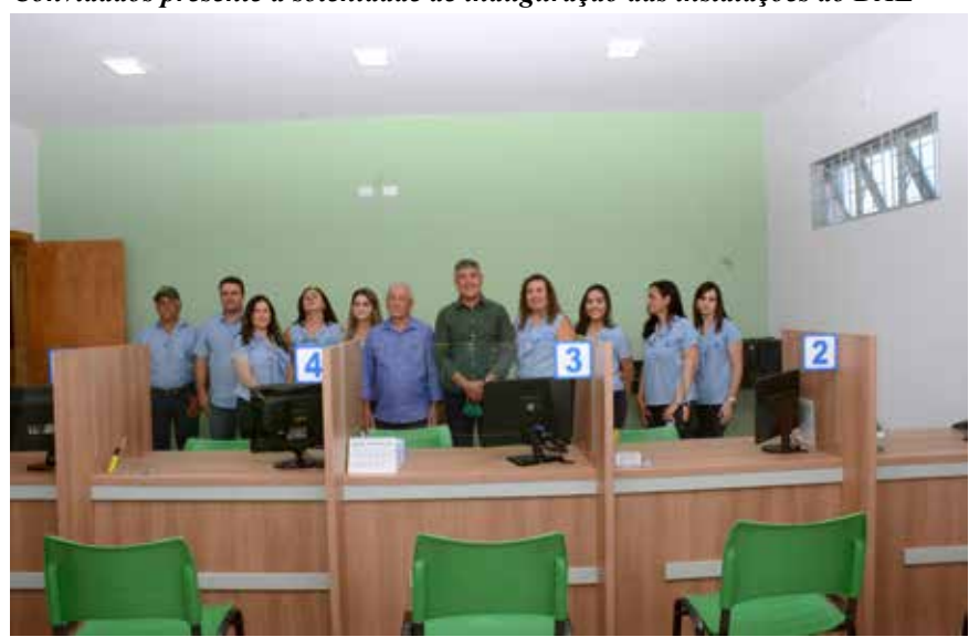
Prefeito e De Assis com parte dos servidores do DAE