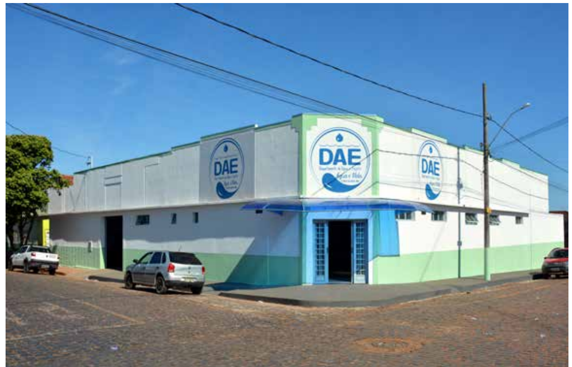
Fachada do prédio que passa a abrigar as instalações do DAE

Segundo De Assis, foi graças ao apoio incondicional do prefeito municipal que o DAE buscou realizar uma gama de serviços, até mesmo fora de suas especificações, mas que, de acordo com a necessidade premente do município, foram necessários ser feitos, como instalações de redutores de velocidade