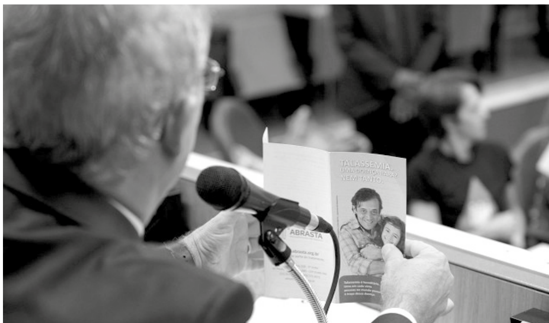
Em 2018, as políticas públicas voltadas às pessoas com doenças raras foram debatidas pela Comissão de Defesa dos Direitos da Pessoa com Deficiência

O deputado Zé Guilherme ressalta que as discussões propostas objetivam disseminar informações e