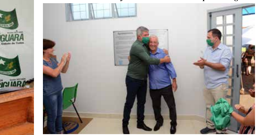
Prefeito e De Assis em momento de cordialidade