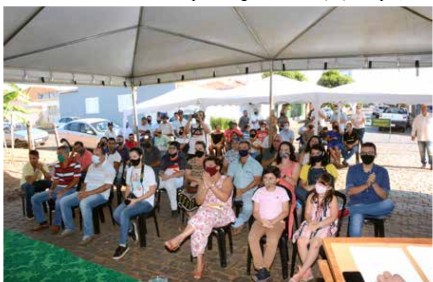
Convidados presente à solenidade de inauguração das instalações do DAE