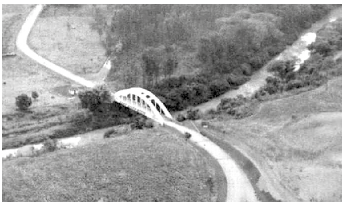
Ponte Melo Viana antes de ser coberta pelas águas do reservatório de Furnas

A grande baixa nas águas do reservatório de Furna, que alimenta a Hidroelétrica de Itumbiara, deixou parte da história do município à descoberta, avivando em muitos tupaciguarenses uma saudade das muitas coisas que foram perdidas com a construção do reservatório. Informações passadas dão conta de que a expressiva baixa das águas do reservatório não se deu pela falta de chuva, mas sim por um processo regulatório das águas feito pela própria Hidroelétrica de Itumbiara. Destaca-se que o reservatório, que por sinal cobriu expressiva parte de terra do município de Tupaciguara, colocando submersas em sua lâmina d'água terras extremamente produtivas, destacadas como de cultura, nunca chegou ao nível em que se