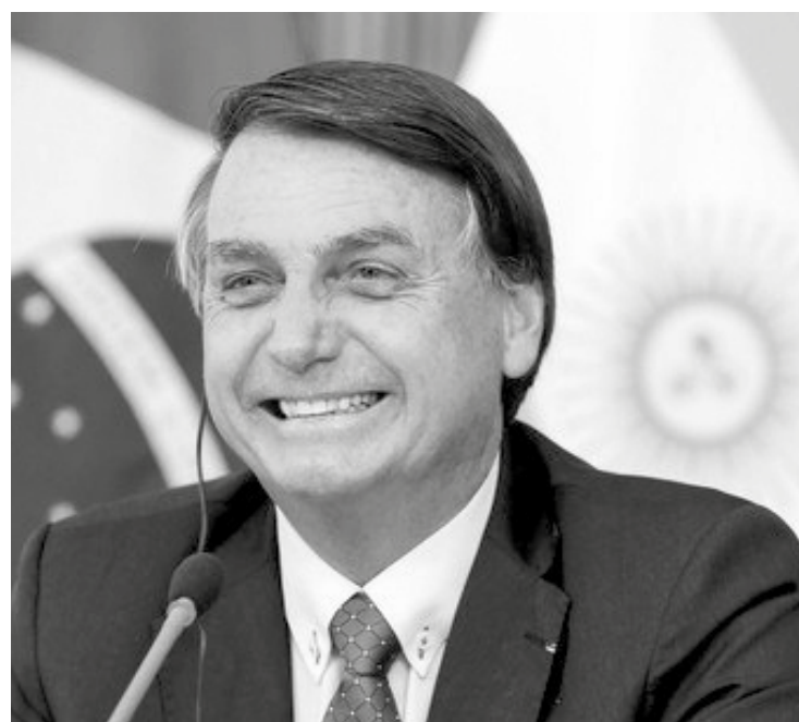
Presidente Jair Messias Bolsonaro

Em reunião extraordinária, a diretoria da reguladora optou, com unanimidade, por revogar despacho de maio que mantinha as contas em bandeira verde, sem custos adicionais para o consumidor, até o final de dezembro por causa dos efeitos da