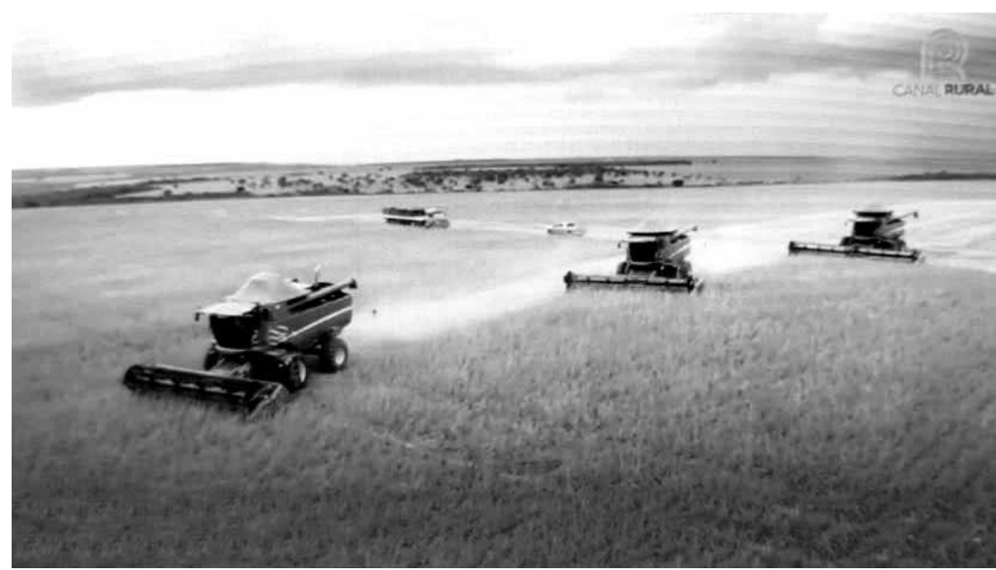
Colhedeiras colhendo soja na Fazenda Alvorada