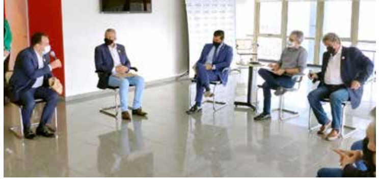
Prefeito expõe demandas do município a Romeu Zema