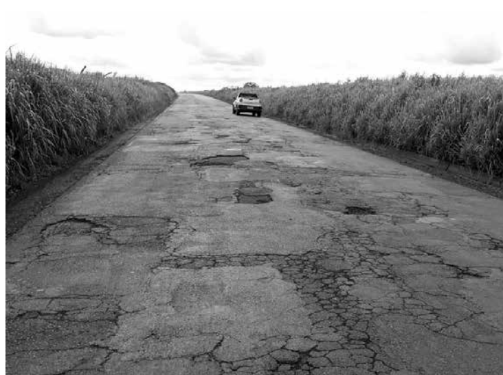
Trecho da MGC-452 mostra a situação degradante da rodovia

Segundo o Jornal O Regional (Itumbiara), ao falar