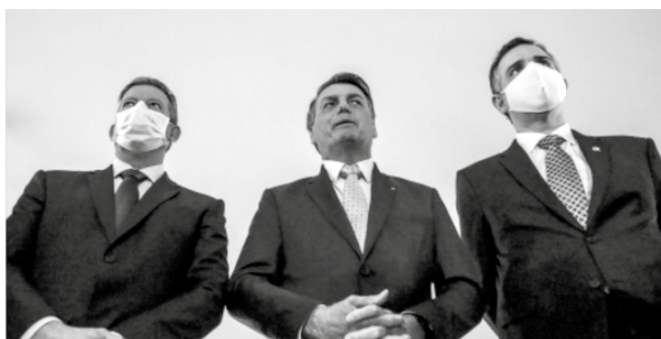
Artur Lira, Bolsonaro e Rodrigo Pacheco

Por Agência Estado - O comando do Congresso sinalizou na terça-feira (8) que quer uma via expressa para a retomada do auxílio emergencial. Os gastos com o benefício devem ficar de fora do limite do teto de gastos, a regra que proíbe que as despesas cresçam em ritmo superior à inflação. Além disso, ao contrário do que defende o ministro da Economia, Paulo Guedes, a nova rodada do auxílio não deve prever contrapartidas, como a aprovação de medidas de controle de gastos.