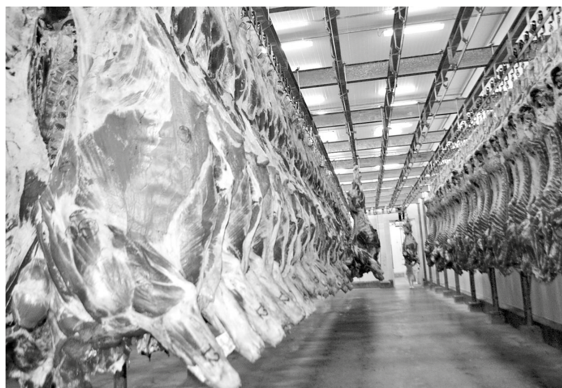
Frigorífico de abate bovino