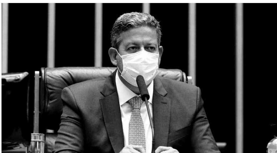
Arthur Lira diz que não é o momento para CPI

grama, como Renda Cidadã ou Renda Brasil, ou pelo incremento do Bolsa Família”, observou, citando uma discussão que já ocorre no governo federal