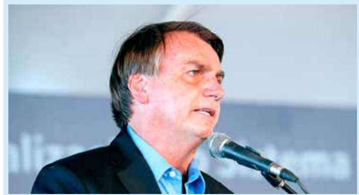
Covax Facility é aliança internacional para desenvolver e distribuir vacinas contra a covid-19

O presidente sancionou a lei que autoriza o Brasil a entrar no consórcio Covax Facility para desenvolvimento de imunizantes