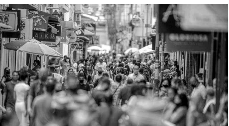
Aglomeração de pessoas é uma das principais causas para o aumento

Números atualizados desta terça-feira mostram de 257,3 mil óbitos e 10,64 milhões de casos acumulados