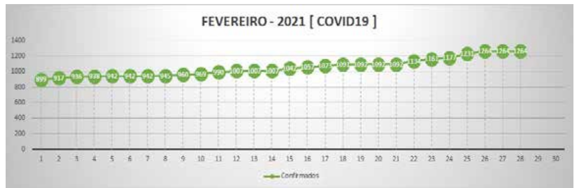
Gráfico de evolução dos casos Covid-19 no mês de fevereiro em Tupaciguara

(Texto e foto Secom) A Prefeitura de Tupaciguara, por meio da Secretaria Municipal de Saúde, tem trabalhado incessantemente para enfrentar a Covid-19 em várias frentes. No entanto, durante todo o mês de fevereiro, casos graves e de extrema urgência no município seguem aumentando, tendo ultrapassado mil pessoas já contaminadas pelo novo coronavírus. Na tarde desta última terça-feira (02), foram apresentados dados do município que mostram a necessidade de a população fazer a sua parte.