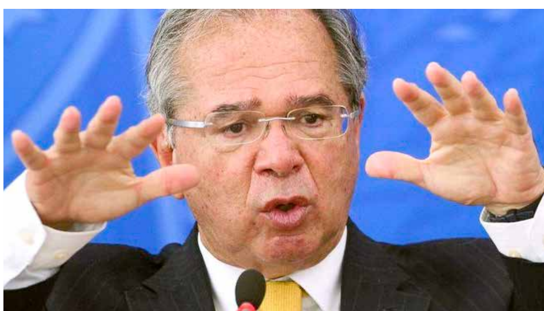
Guedes alertou para o risco de o Brasil se tornar uma nova Argentina ou Venezuela

Guedes repetiu que “o Brasil era o paraíso dos rentistas e o inferno dos empreendedores, mas era uma promessa falsa”. Em seguida, questionou: