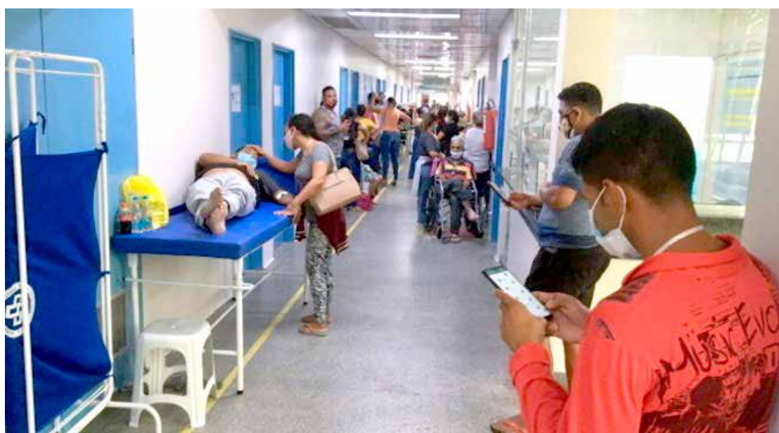
A variante do Brasil apresenta dez vezes mais carga viral nas células do doente

O plasma imune de doadores de sangue curados