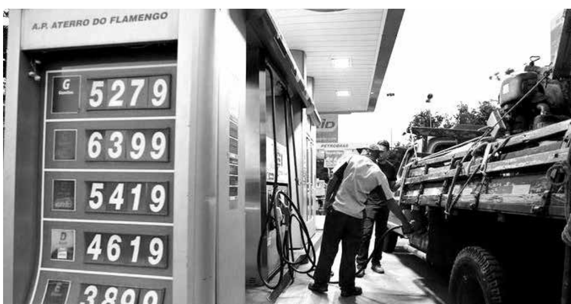
Preço médio atual pago pelo litro do diesel no Brasil é de R$ 4,184, diz ANP

Zingales alerta ainda que o repasse integral da isen-