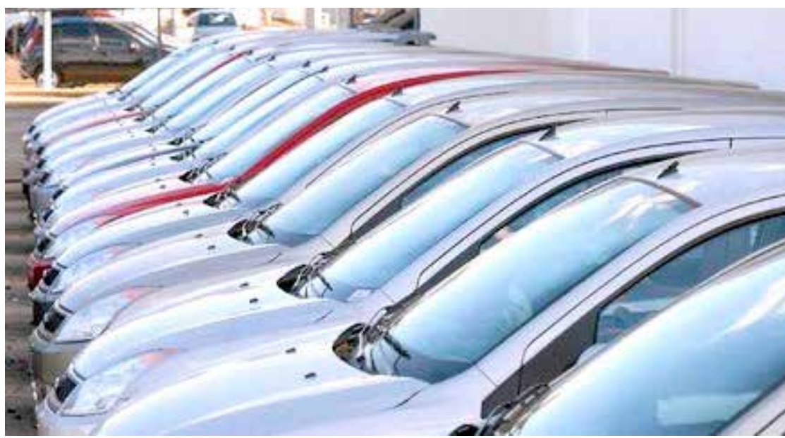
Setor de veículos vendeu 16,2% menos em 2020

Por Agência Estado - O Indicador de Atividade do Comércio da Serasa Experian registrou a maior retração de toda a série histórica do índice, iniciada em 2001. Segundo o levantamento, a atividade do comércio tem queda de 12,2% no acumulado anual de 2020 em comparação a 2019.