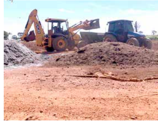
Calagem no solo da Horta Municipal