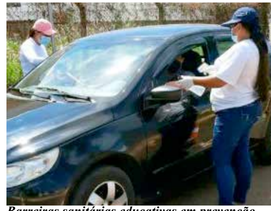
Barreiras sanitárias educativas em prevenção ao coronavírus