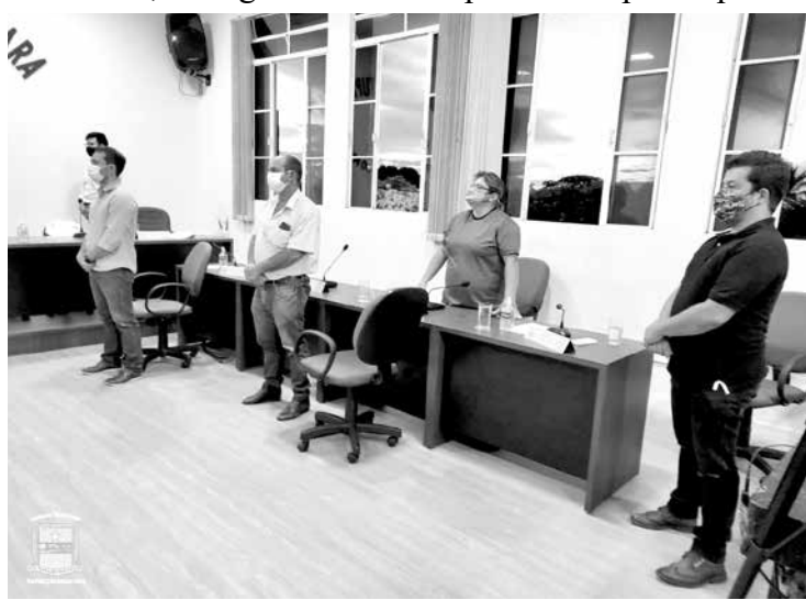
Parte dos Vereadores que esteve presente à reunião