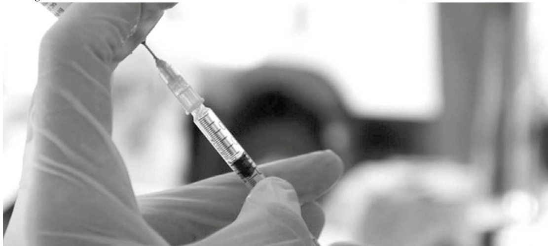
Campanha de vacinação contra a gripe do governo federal e agora serão imunizados apenas em maio. Na prioridade, ficaram crianças e gestantes, que não podem ainda tomar vacina contra a Covid-19, e os profissionais da saúde, que foram os primeiros a serem vacinados contra a doença, pelo Programa Nacional de Imunizações.

(Fonte: O Globo) - No início do terceiro mês de campanha de imunização contra a Covid-19, brasileiros podem preparar o braço para a maior campanha vacinal do Brasil: a imunização contra a gripe. Teve início no dia 12 de abril, quando os postos de saúde de todo o país iniciaram a Campanha Nacional de Imunização contra o vírus influenza, estruturado anualmente pelo Sistema Único de Saúde (SUS). Neste ano, a vacinação deve ocorrer entre 12 de abril e 9 de julho.