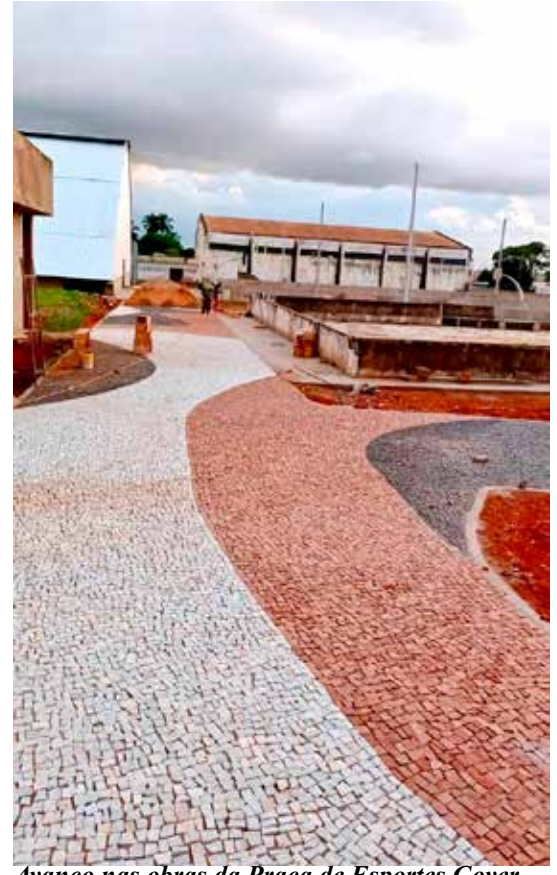
Avanço nas obras da Praça de Esportes Governador Bias Fortes