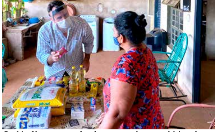
Prefeito Neto, acompanhando a entrega das cestas básicas do programa “O Amor Alimenta”

“Esses primeiros 100 dias da nossa gestão foram de trabalho intenso, como não poderia deixar de ser. Estamos enfrentando a mais grave crise deste século, uma batalha contra um inimigo invisível que já ceifou muitas vidas e tem afetado muito duramente a saúde pública e a economia. Mesmo com as limitações e os desafios que essa conjuntura impõe à gestão pública, conseguimos avançar com melhorias em muitas áreas e fazer algumas entregas importantes para a população. Nosso desejo é de que a vacinação contra Covid-19 avance, para que nossa cidade supra a perda de tantas vidas e possa ir retomando o seu ritmo normal, em todos os setores” , avaliou o prefeito, Francisco Neto.