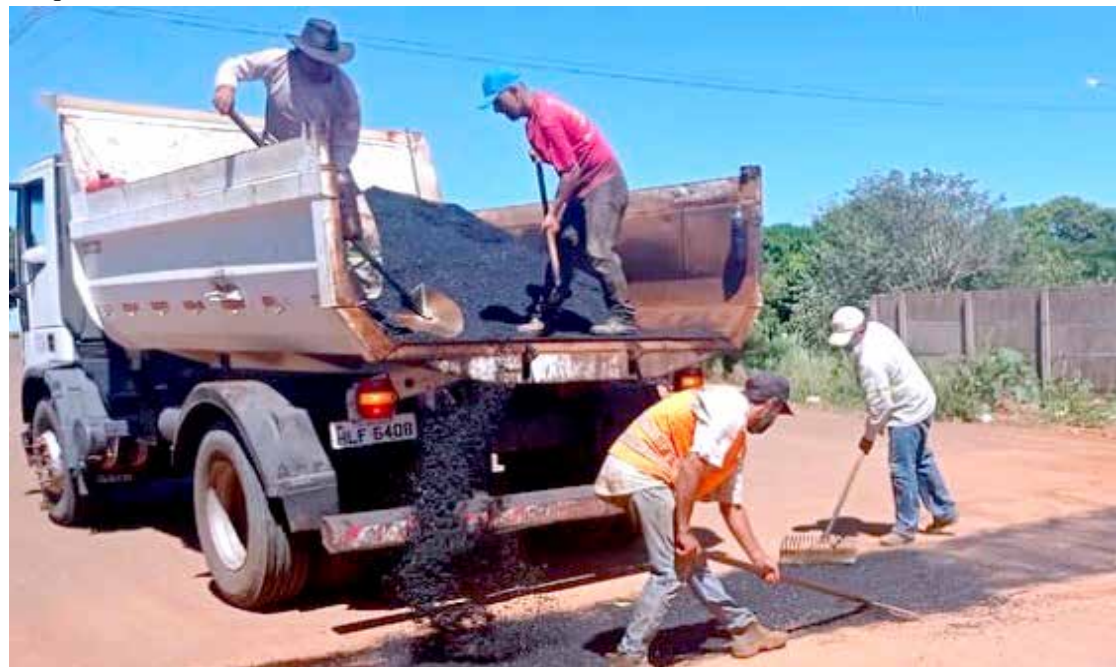
Realização de um dos trabalhos da operação “tapa-buracos”