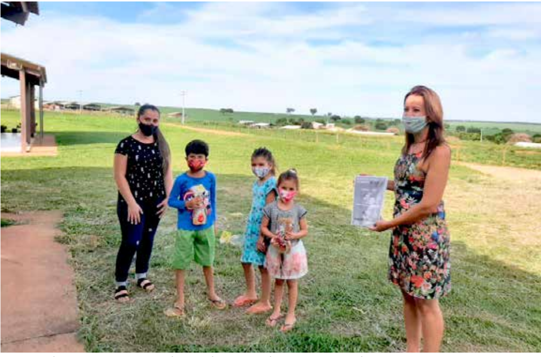
Entrega dos PETs - Programa de Estudos Tutorados, na zona rural

No combate ao coronavírus, destaca-se a vacinação, iniciada no dia 20 de janeiro. Mais de 5 mil doses da vacina já foram aplicadas (somando primeira e segunda doses), nos grupos prioritários dos trabalhadores da saúde, em pessoas acolhidas em instituições de longa permanência (ILPIs) e em idosos a partir dos 65 anos. Também foi