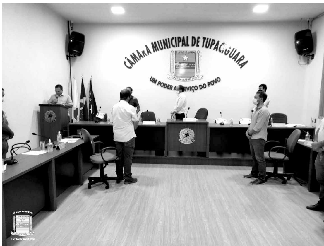
Início da Reunião Extraordinária que reprovou contas do ex-prefeito Alexandre Berquó Dias

gestores que tiverem suas contas relativas ao exercício de cargos ou funções públicas rejeitadas por irregularidade insanável, que configure ato doloso de improbidade administrativa, e por decisão irreversível do órgão competente, salvo se esta houver sido suspensa ou anulada pelo Poder Judiciário, para as eleições que se realizarem nos 8 (oito) anos seguintes, contados a partir da data da decisão, aplicando-se o disposto no inciso II do art. 71 da Constituição Federal, a todos os ordenadores de despesa, sem exclusão de mandatários que houverem agido nessa condição. Foi embasado na Lei da Ficha Limpa que o ex-prefeito Alexandre Berquó Dias passa a estar impedido de participar de