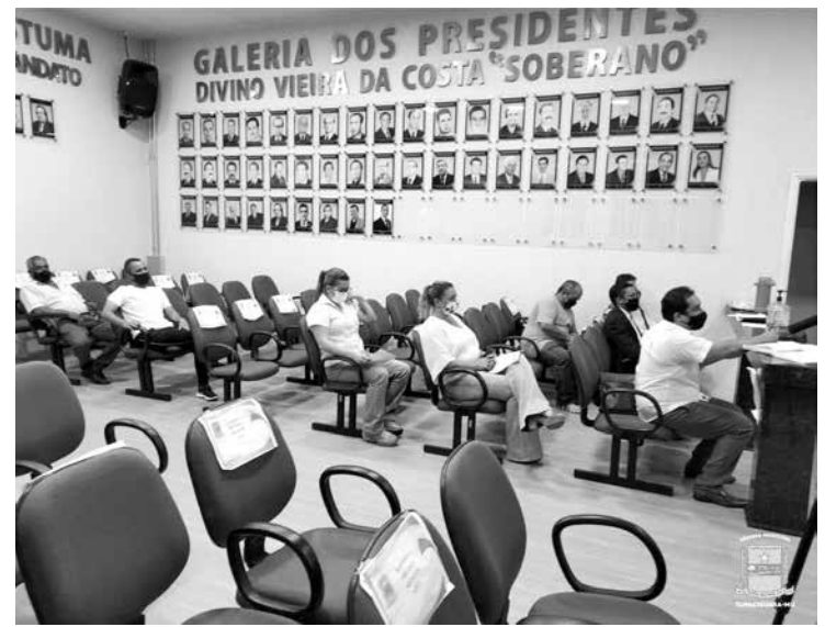
Público presente à reunião