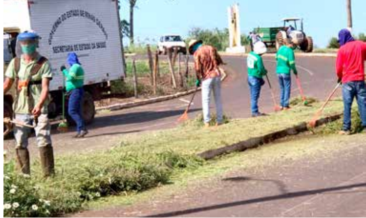
Equipes de Limpeza Urbana trabalhando para manutenção das vias públicas