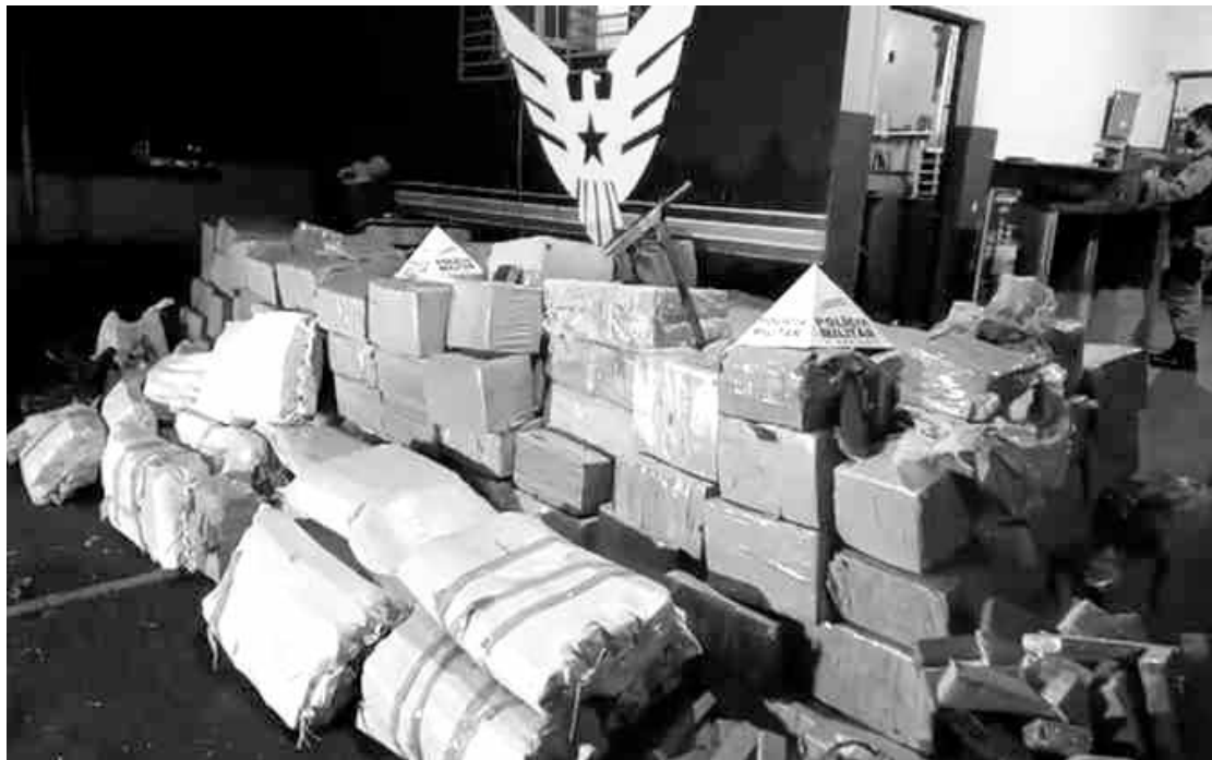
Droga que foi encontrada em poder do acusado

O suspeito tem 49 e foi preso depois que, interrogado pelos policiais, informou