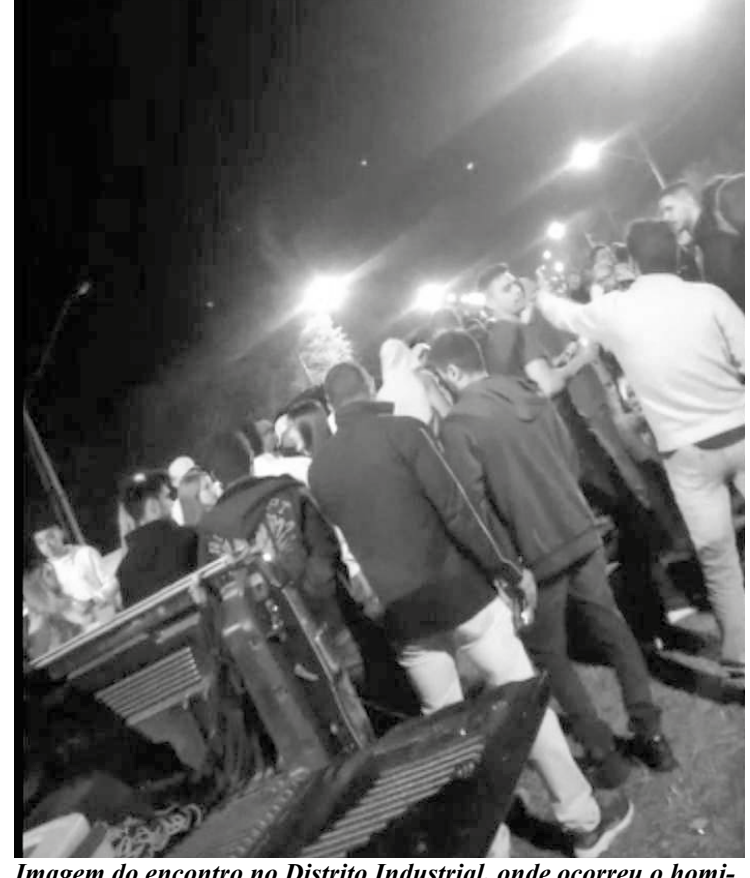
Imagem do encontro no Distrito Industrial, onde ocorreu o homicídio (imagem extraída de vídeo)

Caso não sejam tomadas medidas que auxiliem a Polícia Militar no seu trabalho de segurança preventiva, o número que a fiscalização da covid oferece na página da prefeitura, com certeza, será novamente ligado, já que, mediante a quantidade de aglomerações que está acontecendo, fará com que esse mal volte a crescer na cidade. Deve ser salientado que atualmente o número de fiscais e de policiais em Tupaciguara não é suficiente para atender tamanha demanda de abusos que está acontecendo.