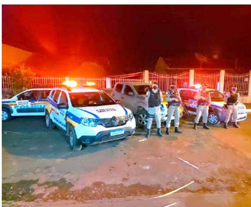
Policiais que estiveram envolvidos nos cerco aos ladrões do veículo

Segundo informações levantadas, o veículo havia sido roubado no município de Estrela do Sul/MG.