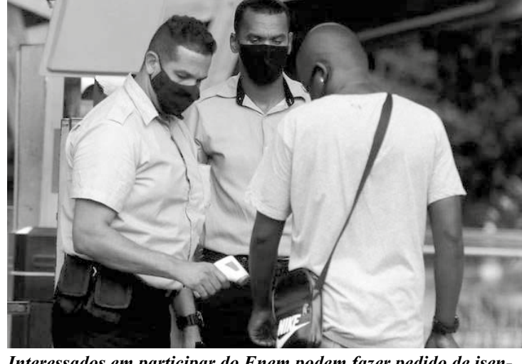
Interessados em participar do Enem podem fazer pedido de isenção da taxa de inscrição

A preocupação com a data do exame começou após a publicação de uma