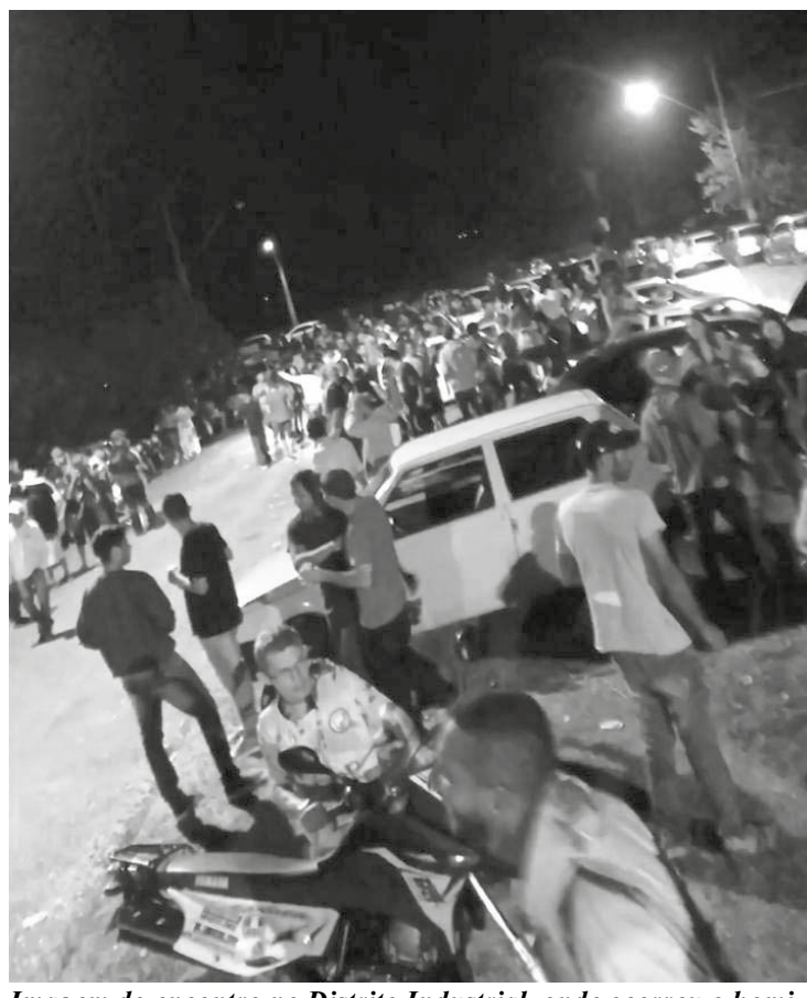
Imagem do encontro no Distrito Industrial, onde ocorreu o homicídio (imagem extraída de vídeo)

Deve ser destacado ainda que a perturbação do sossego e do descanso das pessoas que residem nas