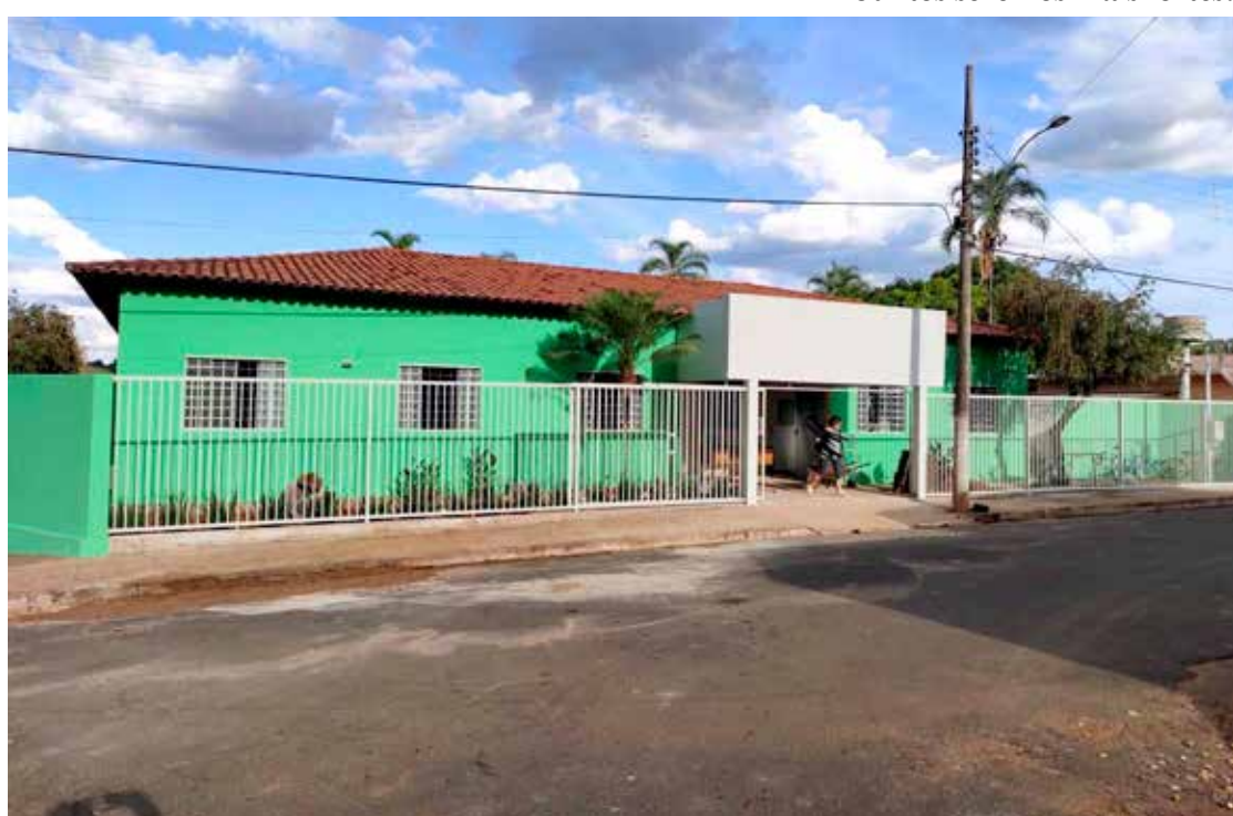
As obras de reparo do prédio foram feitas em ritmo acelerado, para o atendimento do cidadão