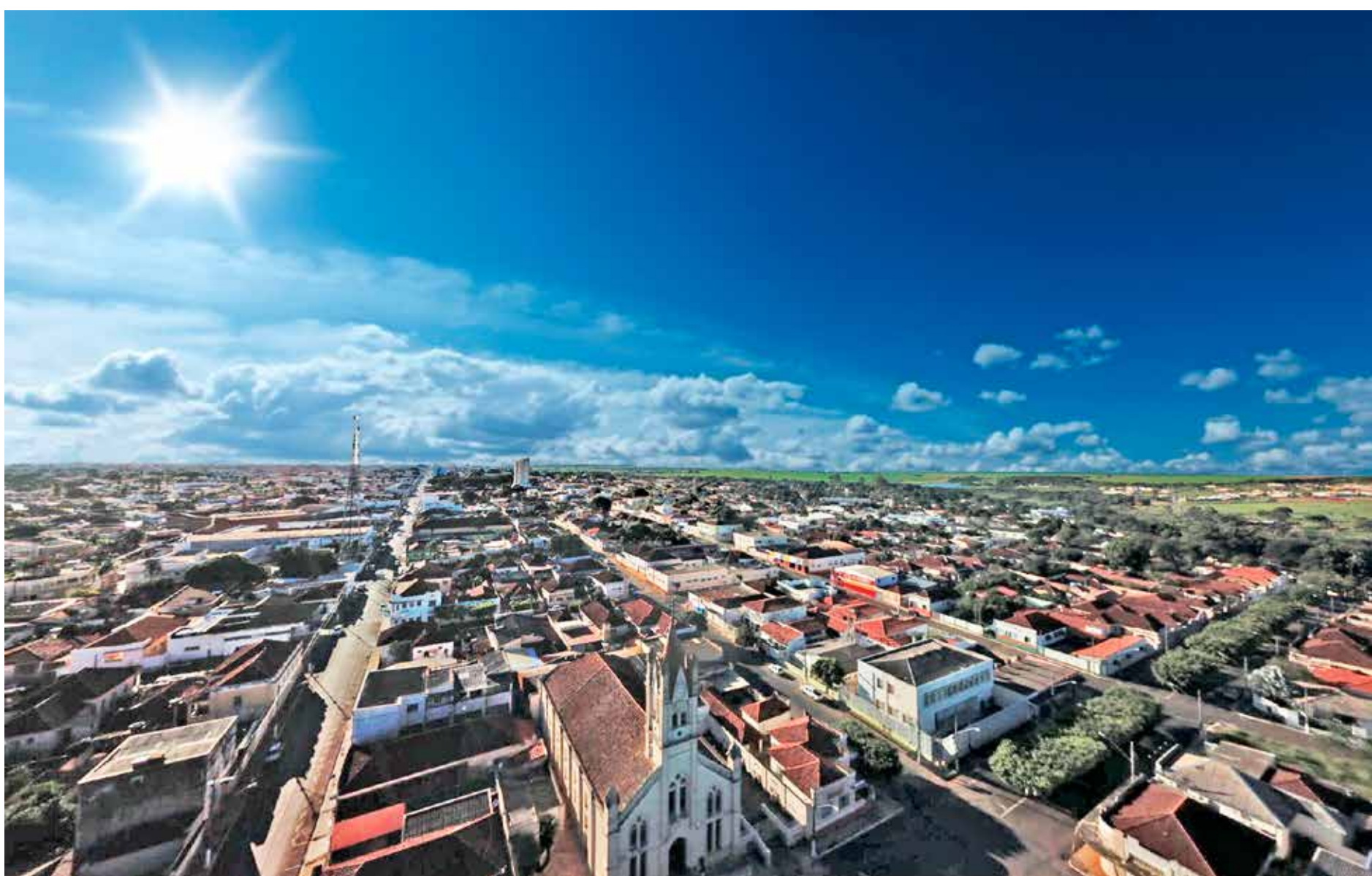
Vista aérea de parte da cidade de Tupaciguara, tendo como base a Igreja Matriz de Nossa Senhora da Abadia

“Retrata a história da Faculdade de Medicina Veterinária que foi criada em 1971. Em 1972, foi realizado seu primeiro vestibular. Em janeiro de 1973, a Faculdade de Medicina Veterinária, até então sediada na cidade de Tupaciguara, foi incorporada à Universidade de Uberlândia. No ano de 1974, o Conselho Univer-