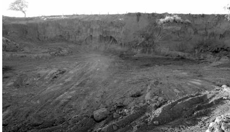
Local onde será construído o stand de tiros no CIISP