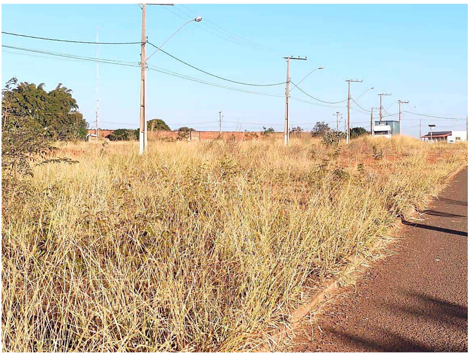
O capim, o mato e a falta de conservação das vias públicas são marcas do descaso e da falta de respeito de quem produz naquele local

Por outro lado, o zelo e cuidado pelo que necessita o Distrito Industrial também cabem a Secretaria de Desenvolvimento Econômico, mas pelo visto falta