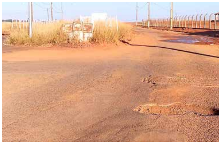
A conservação do asfalto das vias do distrito deixa muito a desejar