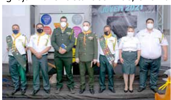
Pastores e fiéis que conduziram a cerimônia