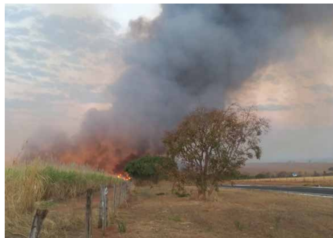
O fogo atingiu um canavial e área de preservação

De acordo com dados levantados, o fogo expandiu para três áreas de preservação