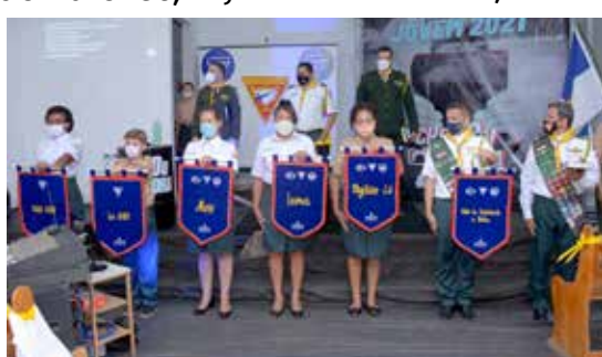
Metas a serem alcançadas por um Desbravador