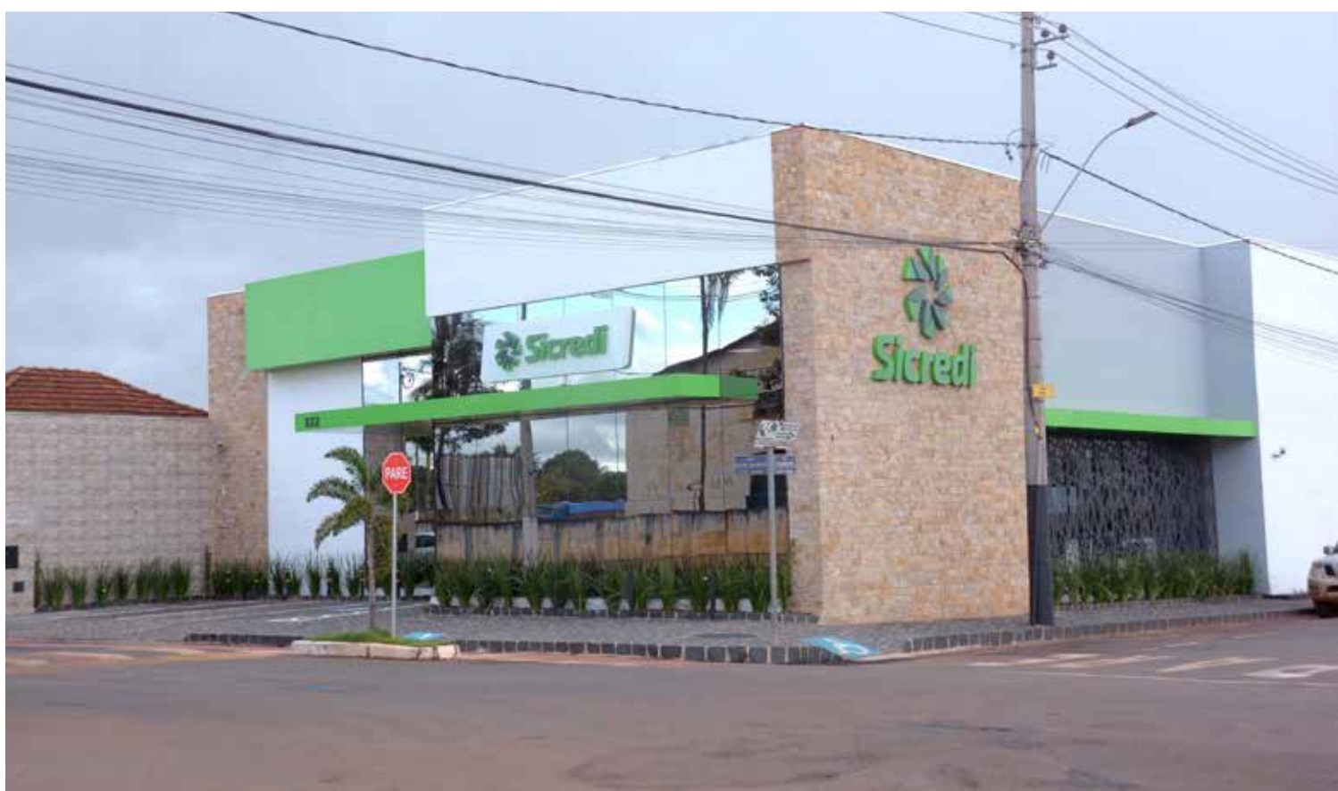
Fachada da linda agência do Sicredi de Tupaciguara

Além de contribuir para a expansão do cooperativismo de crédito na cidade. E os benefícios são apontados em pesquisa da Fundação Instituto de Pesquisas Econômicas (Fipe), encomendada pelo Sicredi em 2020. Conforme o estudo, o cooperativismo incrementa o Produto Interno Bruto (PIB) per capita dos municípios em 5,6%, cria 6,2% mais vagas de trabalho formal e aumenta o número de estabe-