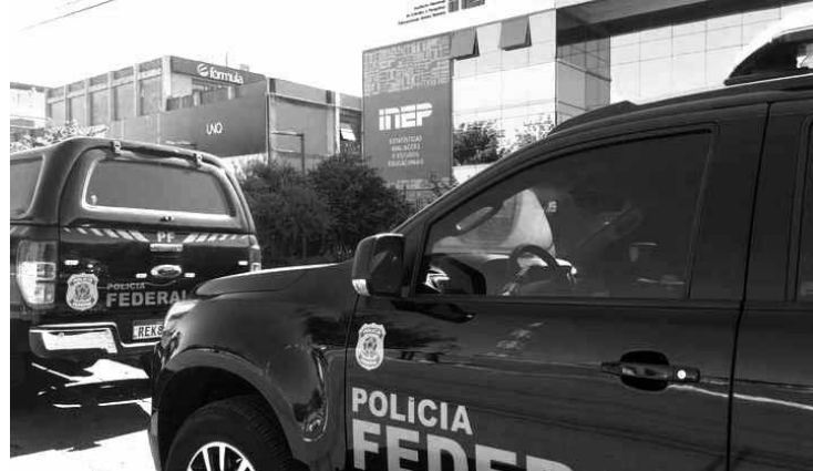
Ação apura irregularidades em contratos no valor de R$ 130 milhões

Os suspeitos são investigados pelos crimes de organização criminosa, corrupção ativa e passiva, crimes da Lei de Licitações e lavagem de dinheiro, com penas que ultrapassam 20 anos de reclusão.