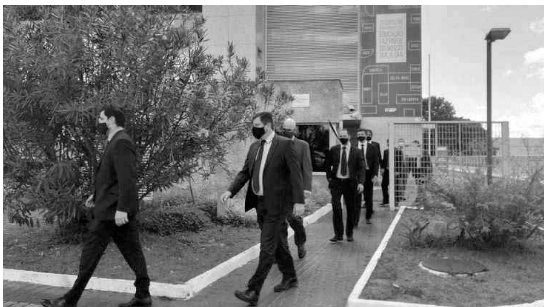
Investigadores deixaram a sede do Inep, em Brasília, após três horas de buscas

busca e apreensão no Distrito Federal, em São Paulo e no Rio de Janeiro. Também foi determinado o sequestro judicial de R$ 130 milhões das empresas e pessoas físicas envolvidas.