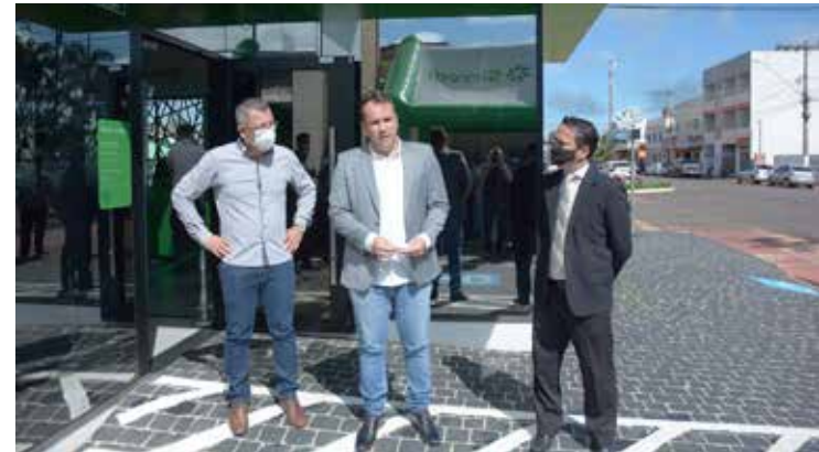
Prefeito Francisco Neto falando aos presentes