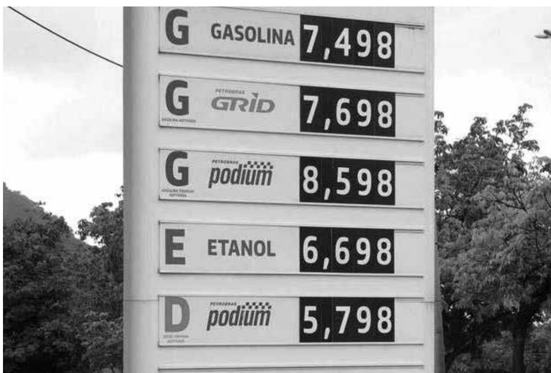
Proposta precisa ser apreciada no plenário - Foto: RICARDO MORAES/REUTERS

A banda móvel de variação para os derivados de petróleo funciona da seguinte forma: