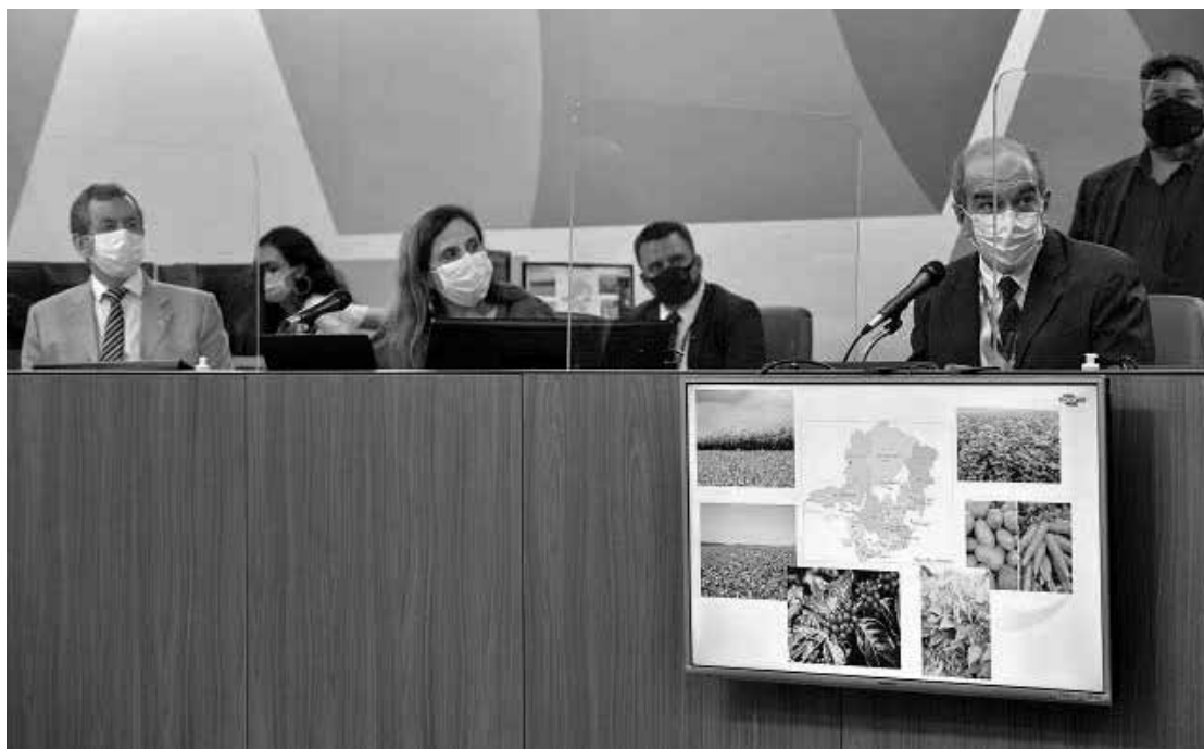
Pesquisadores e especialistas na agricultura defenderam o uso de bioinsumos

Por meio de um vídeo, Alysson Paolinelli abriu a audiência pública que a Comissão de Agropecuária e Agroindústria da Assembleia Legislativa de Minas Gerais realizou nesta quinta-feira (2/12/21).