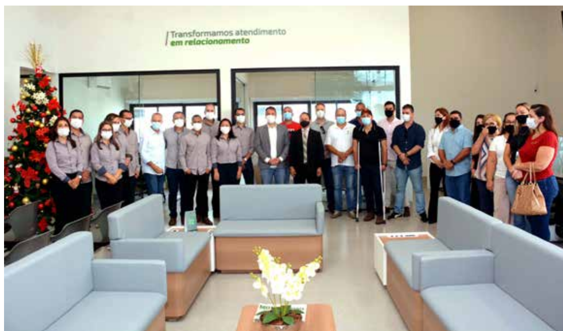
Equipe da agência posando com autoridades e alguns dos presentes à abertura da agência