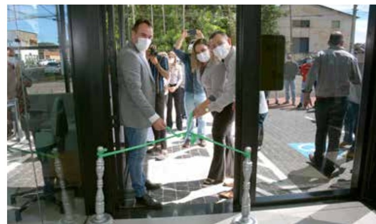
Desenlace da fita inaugural da agência

Com presença nacional, o Sicredi está em 26 estados e no Distrito Federal, com mais de 2.000 agências, e oferece mais de 300 produtos e serviços financeiros ( www.sicredi.com.br ).