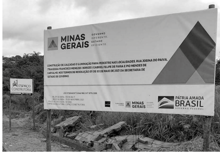
Placa de realização das obras na travessia do Morada Nova