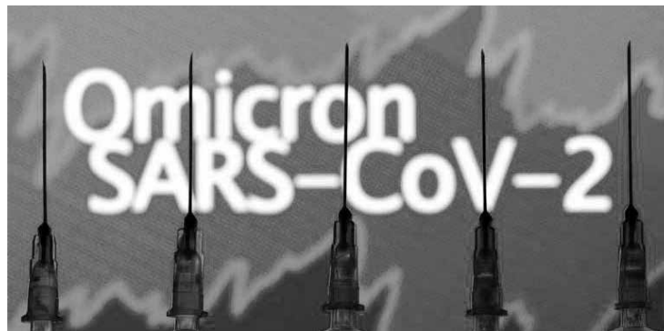
Dados preliminares mostram que a nova variante é menos perigosa que a Delta