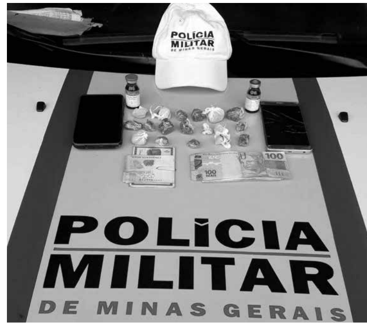
Drogas, dinheiro e celulares encontrados com os acusados

Em conversa com os indivíduos, que eram dois irmãos, foi relatado aos policiais por um dos acusados de que ele seria o dono da maconha, bem como dos anabolizantes encontrados no veículo. Com eles ainda foi localizada uma quantia de R$ 254,00 e dois telefones celulares. Diante do exposto, o veículo e materiais foram apreendidos e os dois elementos conduzidos presos, acusados de tráfico de drogas.