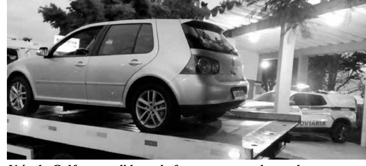
Veículo Golf apreendido onde foram encontradas as drogas

No último dia 02, durante a realização da Operação Férias/Feriado, na rodovia MGC 452, km 55, uma guarnição da Polícia Rodoviária Estadual - PRE,