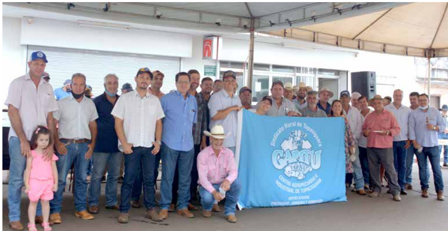
Produtores e populares da sociedade tupaciguarense demonstrando total apoio à iniciativa

Na segunda-feira, 03, a assessoria de imprensa divulgou esta nota: "O Bradesco reitera seu apoio e crença irrestrita ao setor agropecuário. Há décadas é o maior banco privado do agronegócio. Foram a Pecplan e a Fundação Bradesco, com o apoio de seus técnicos, que implantaram e capacitaram milhares de agropecuaristas a fazer inseminação artificial. Com isso, o banco contribuiu decisivamente para a pecuária alcançar o atual e reconhecido nível de excelência mundial".