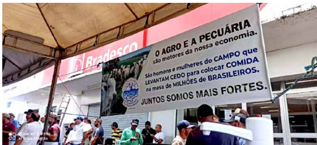
Faixa foi colocada para mostrar a união do agro, contra a interferência de um agente bancário no setor

Na segunda-feira, 03, a assessoria de imprensa divulgou esta nota: "O Bradesco reitera seu apoio e crença irrestrita ao setor agropecuário. Há décadas é o maior banco privado do agronegócio. Foram a Pecplan e a Fundação Bradesco, com o apoio de seus técnicos, que implantaram e capacitaram milhares de agropecuaristas a fazer inseminação artificial. Com isso, o banco contribuiu decisivamente para a pecuária alcançar o atual e reconhecido nível de excelência mundial".