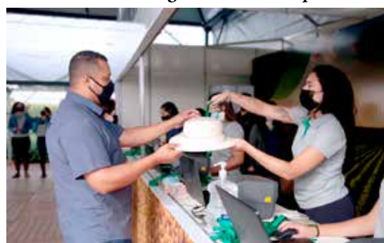
Protec e Semensol oferecem brindes aos participantes