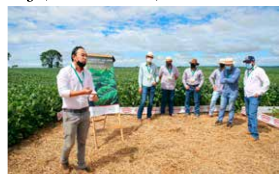
Agricultores recebendo orientações agrícolas