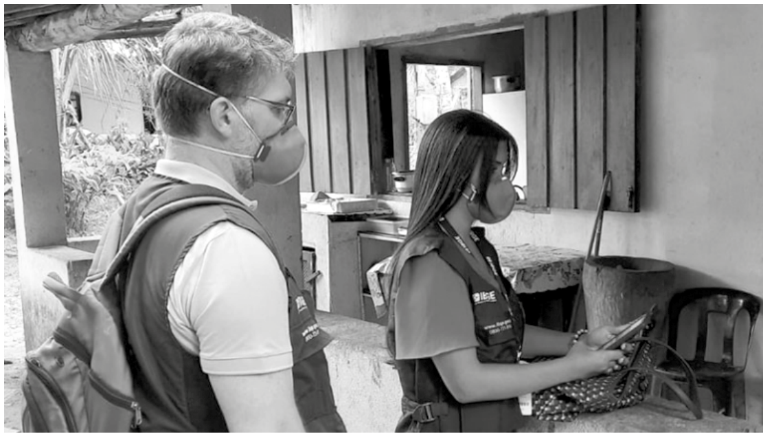
Recenseadores vão visitar mais de 70 milhões de domicílios este ano

Há ainda 18.420 vagas de agente censitário supervisor (ACS) e 5.450 de agente censi-