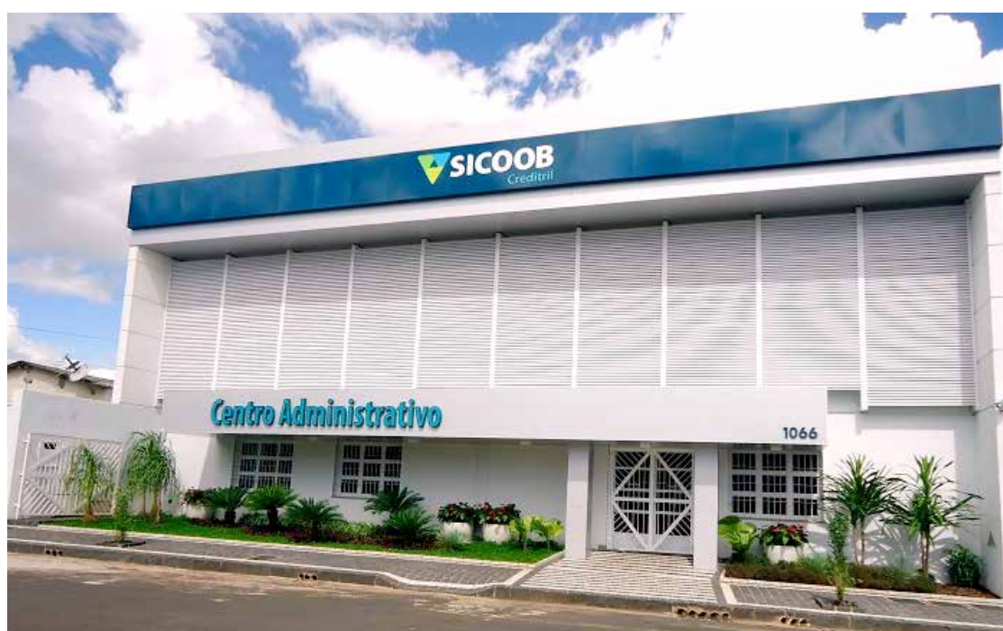
Centro administrativo do Sicoob Creditril sediado em Uberlândia-MG

O Sicoob Creditril foi fundado, quando o cooperativismo financeiro despontava na região do Triângulo Mineiro. Um grupo formado por 21 produtores rurais