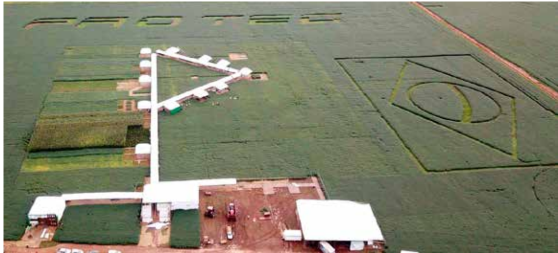
Vista aérea da montagem da estrutura para o Dia de Campo da Protec