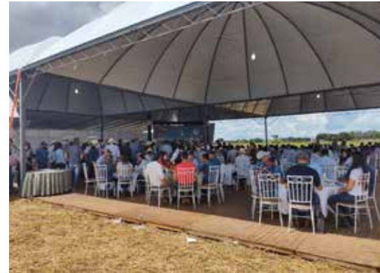
Visitantes sendo recepcionados para o almoço