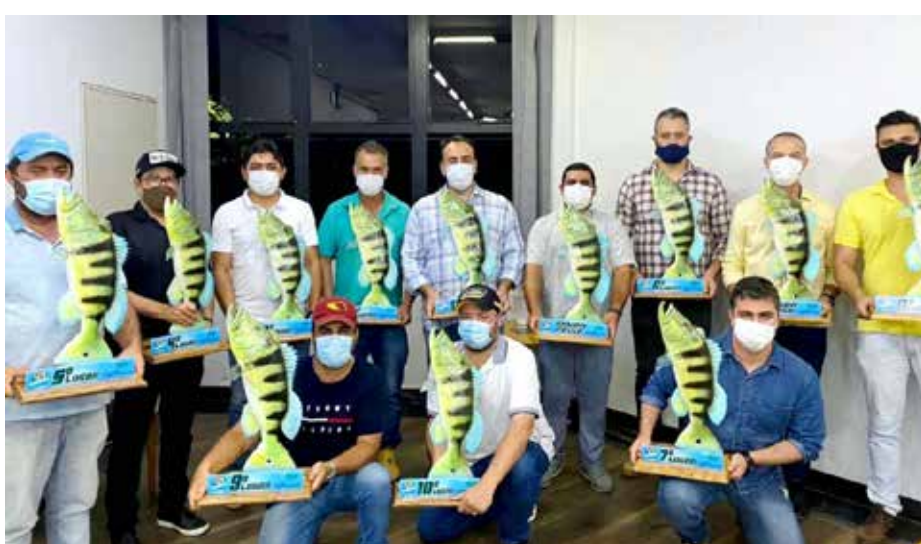
Os vencedores receberam os troféus das mãos do prefeito municipal

A classificação e entrega das premiações mostraram o comprometimento dos competidores e a grande aceitação que esse tipo de esporte está tendo no município o que gera importante divisa para o turismo local, tendo em vista o expressivo número de inscritos no torneio, em especial de outros municípios da região.