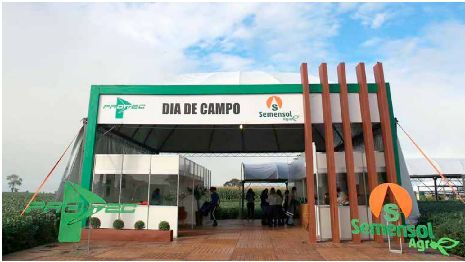
Entrada principal para o Dia de Campo, um evento que se destacou no cenário agrícola de Minas Gerais