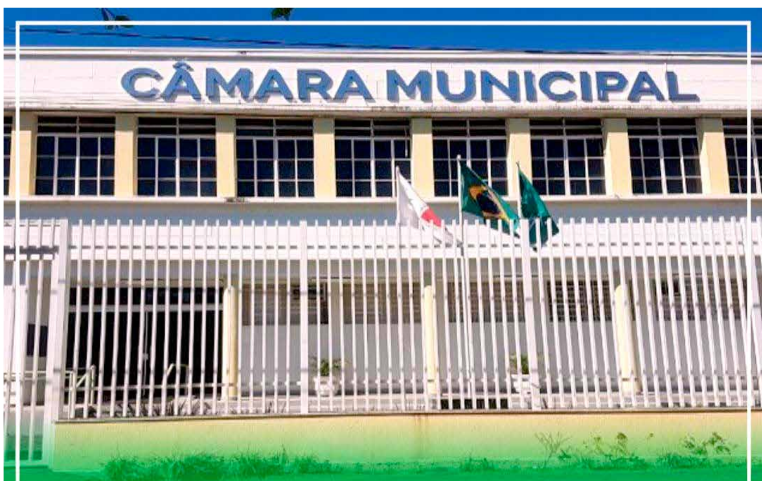
Fachada do prédio que abriga a Câmara Municipal de Tupaciguara

almeja. "Olha, o que eu posso afirmar é que na Câmara Municipal estarão 11 cabeças imbuídas de um único propósito: fazer da dedicação e esmero de cada vereador sinônimo de luta e representatividade de cada cidadão de Tupaciguara, que depositou