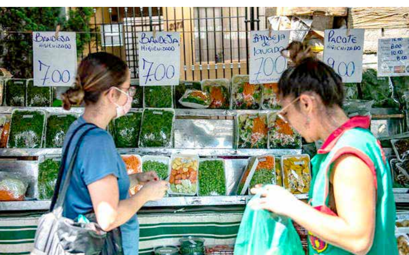
Custo da cesta básica aumentou 48,3% em três anos