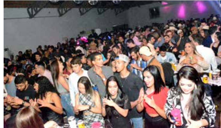
Grande presença de público da Rancho Luxury