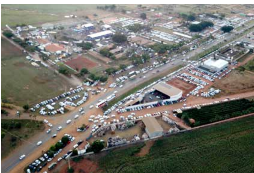
Vista aérea do parque de exposição CAPITU