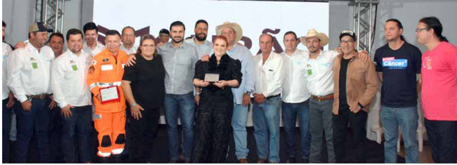
Homenageados que receberam do Poder Legislativo a Moção de Aplauso