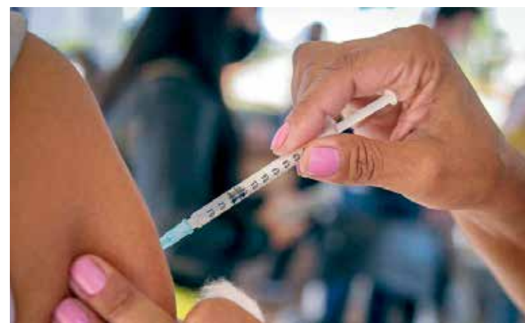
A dose de reforço deve ser aplicada com as vacinas da Pfizer, Janssen ou AstraZeneca