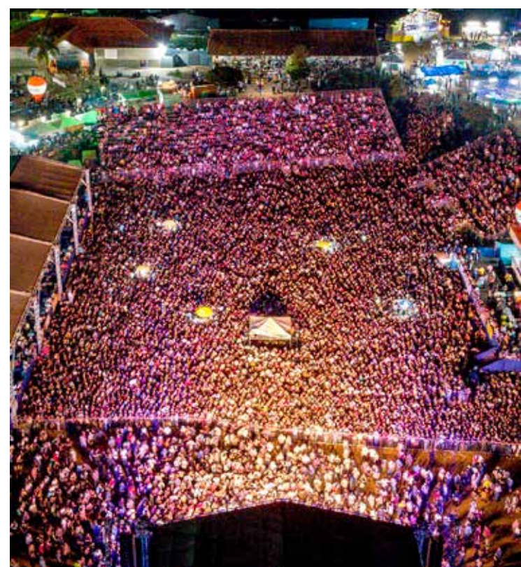
Vista aérea da presença de público no show de Jorge e Mateus