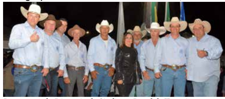
Integrantes da Diretoria do Sindicato Rural de Tupaciguara