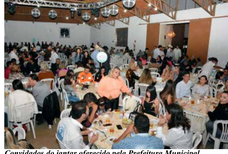
Convidados do jantar oferecido pela Prefeitura Municipal