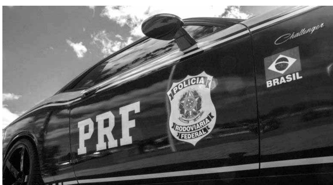
Decisão da Justiça impede atuação da PRF fora de rodovias federais

Segundo o artigo suspenso, a PRF poderia designar efetivo para integrar equipes em operação conjunta com outras forças, prestar apoio logístico, atuar na segurança das equipes e do material empregado, ingressar em locais alvos de mandado de busca e apreensão, mediante