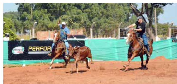
Realização da Prova de Laço