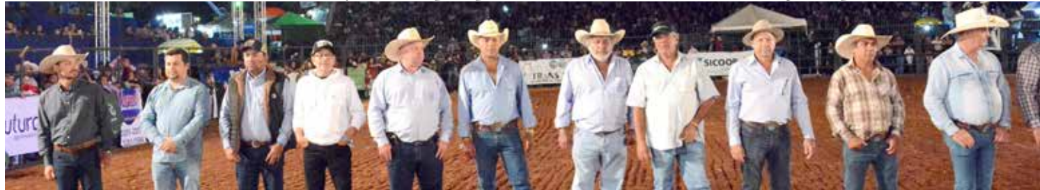
Diretores do Sindicato e vereadores presentes na abertura do Rodeio em Touros