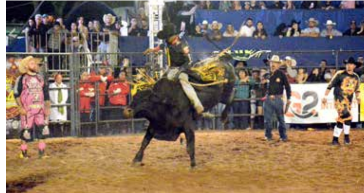
Realização do rodeio em touros