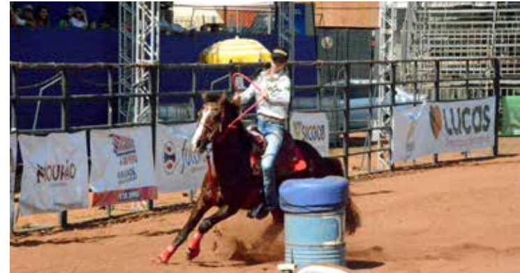
Realização da Prova do Tambor