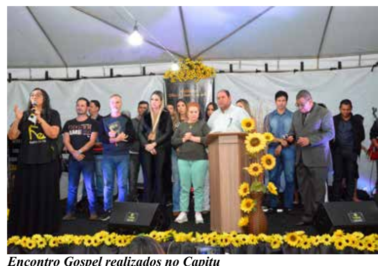
Encontro Gospel realizados no Capitu