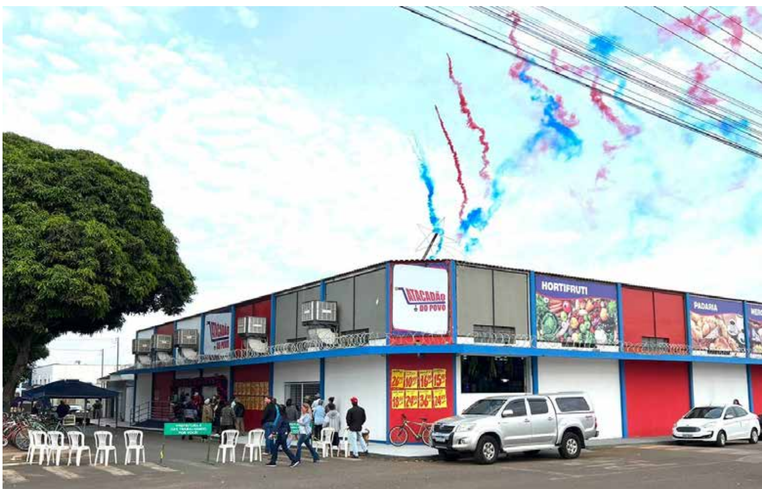
Fachada do Supermercado Atacadão do Povo

No decorrer de todo o sábado, o Atacadão do Povo foi visitado por integrantes da sociedade tupaciguarense que teceram importantes elogios ao supermercado, destacando, principalmente, o fácil acesso aos produtos e, em especial, à circulação dentro da loja. Destaca-se, ainda, que foi oferecido um show com a dupla Rick e Segundeiro, realizado no in-