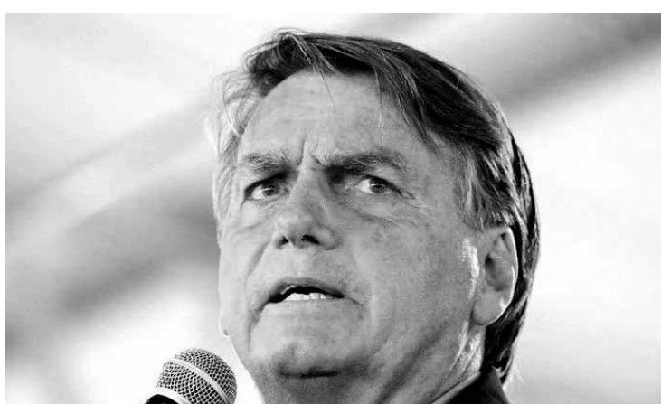
Presidente Jair Messias Bolsonaro

Plínio Aguiar, do R7, em Brasília - O presidente Jair Bolsonaro afirmou, nesta segunda-feira (13), que a eventual aprovação das medidas apresentadas para redução do preço dos combustíveis no país pode diminuir em R$ 2 o valor do litro da gasolina e em R$ 1 o do diesel.