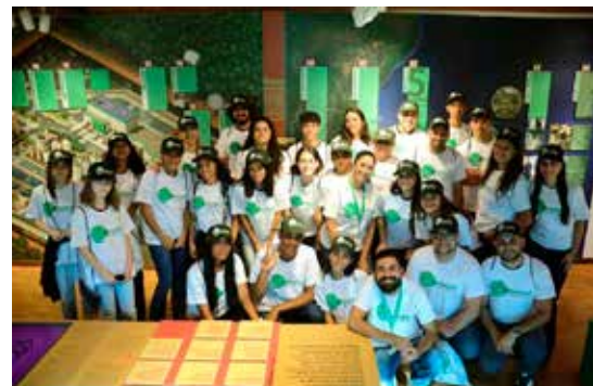
CESA - Centro de Educação Socioambiental