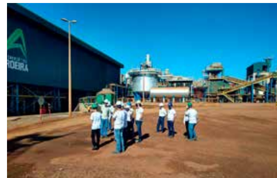
Conhecendo as dependências da usina