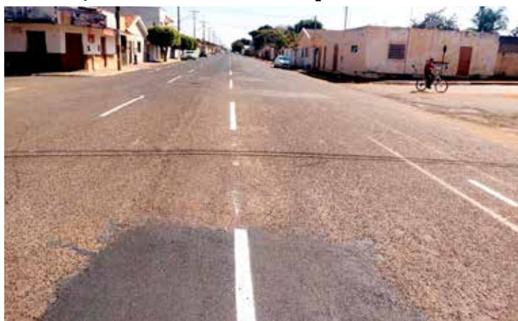
No serviço realizado não existe espaço para ciclistas

Destacamos que as pessoas que pediram anonimato em suas declarações assim o fez, tendo em vista que exercem cargos importantes na cidade e que tem receio, já que perseguição política a quem se opõe ao governante do município, é uma constante em Tupaciguara e pode prejudicar quem discorda do que é realizado. O Jornal respeita esse desejo e usa de sua prerrogativa jornalística de não revelar suas fontes de informações.