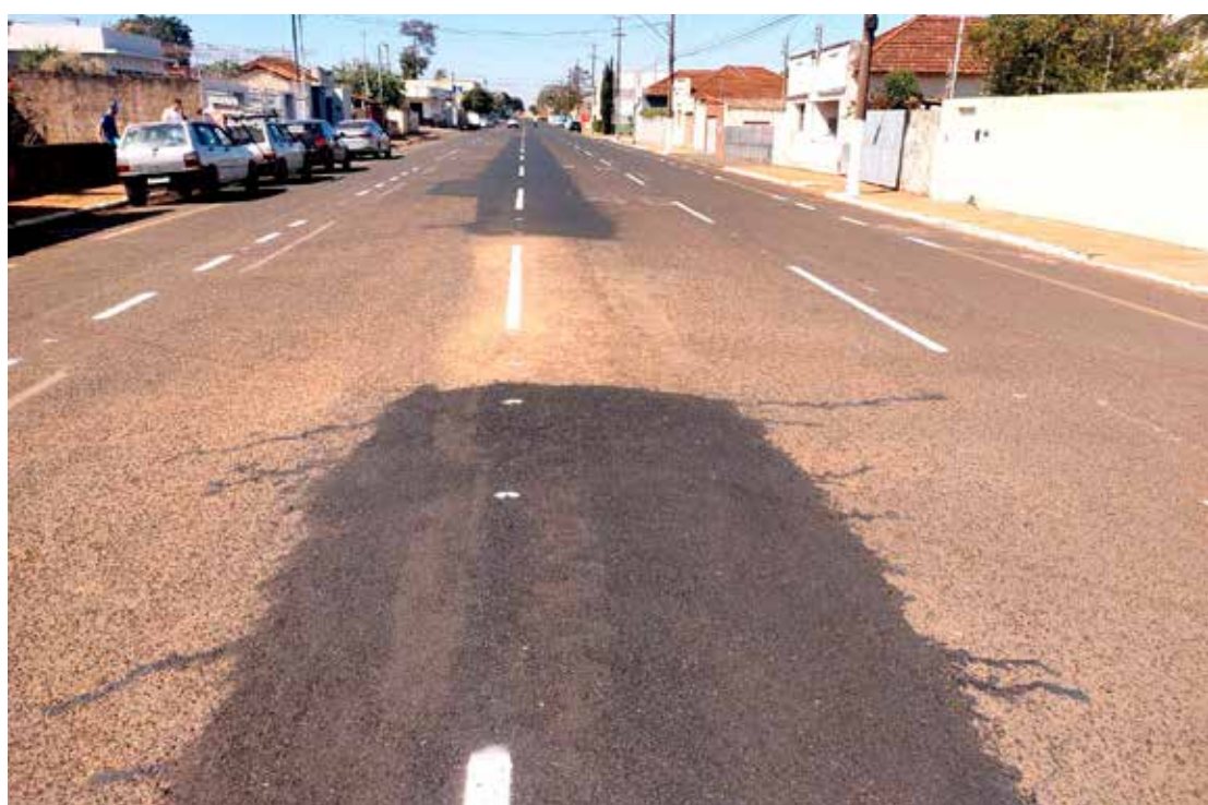
Na imagem se vê claramente a gambiarra que foi realizada na Rua Rodrigo do Vale

Quem acompanhou a realização do tapa-buracos realizado naquela via pública pôde observar que a fina espessura da massa asfáltica, colocada onde foi retirado o canteiro central, é algo merecedor de críticas e reprovação por parte da população e que, por certo, não terá muito tempo de durabilidade.