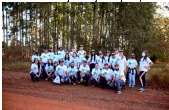
Área verde LD Celulose