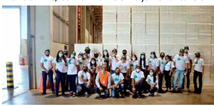
Fardos de celulose prontos para exportação.

rentes disciplinas com a prática real do mundo do trabalho, a qual é capaz de fortalecer os vínculos entre educação escolar e o contexto social, além de manter relação com os conhecimentos teórico-práticos adquiridos durante todo o processo.