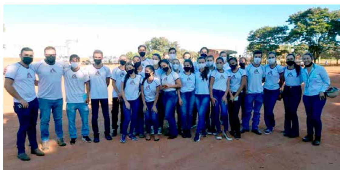
Chegada dos estudantes à Bioenergética Aroeira

Na oportunidade, os alunos da Escola Estadual de Ensino Médio, única em Minas Gerais a ofertar cursos técnicos nessa área,