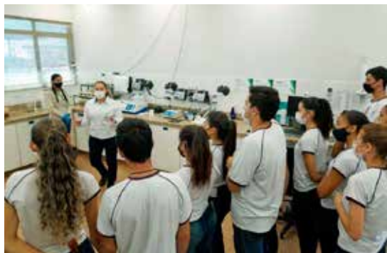
Visita ao laboratório da Bioenergética Aroeira