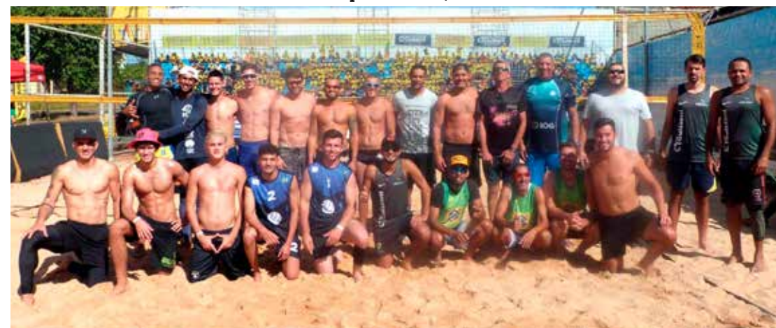
Duplas participantes do Zul Sports Vôlei de Praia