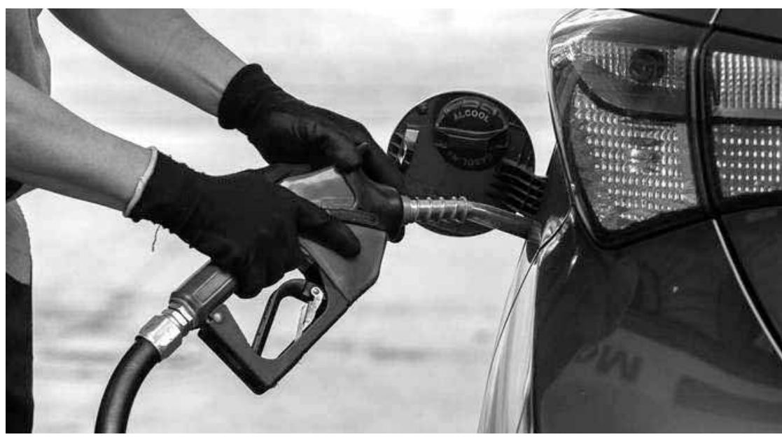
Combustíveis ficaram 14% mais baratos em julho - FOTO: EDU GARCIA/R7

Kislanov destaca que, além da redução da alíquota de ICMS cobrada sobre os servi-