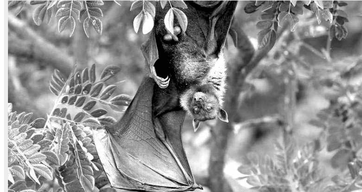
Morcegos como raposas voadoras são reservatórios naturais de Henipavirus

Langya é da mesma família de outros patógenos mais antigos, como o Nipah e o Hendra, que provocaram surtos nos últimos anos