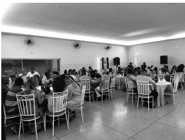
Parte dos presentes na festiva de Natal