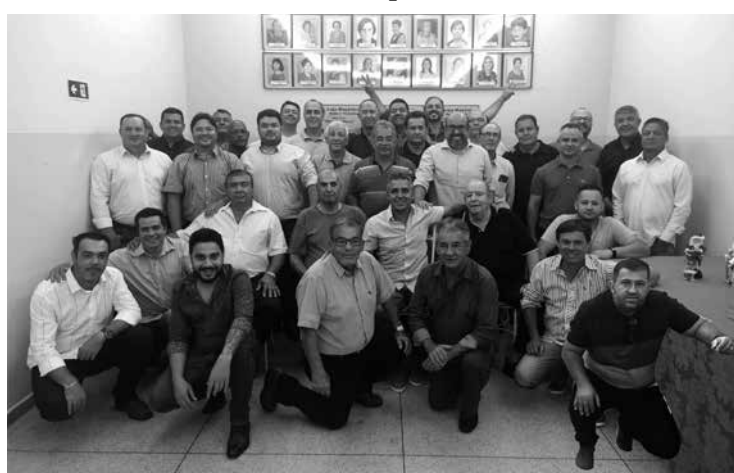
Maçons presentes na festiva