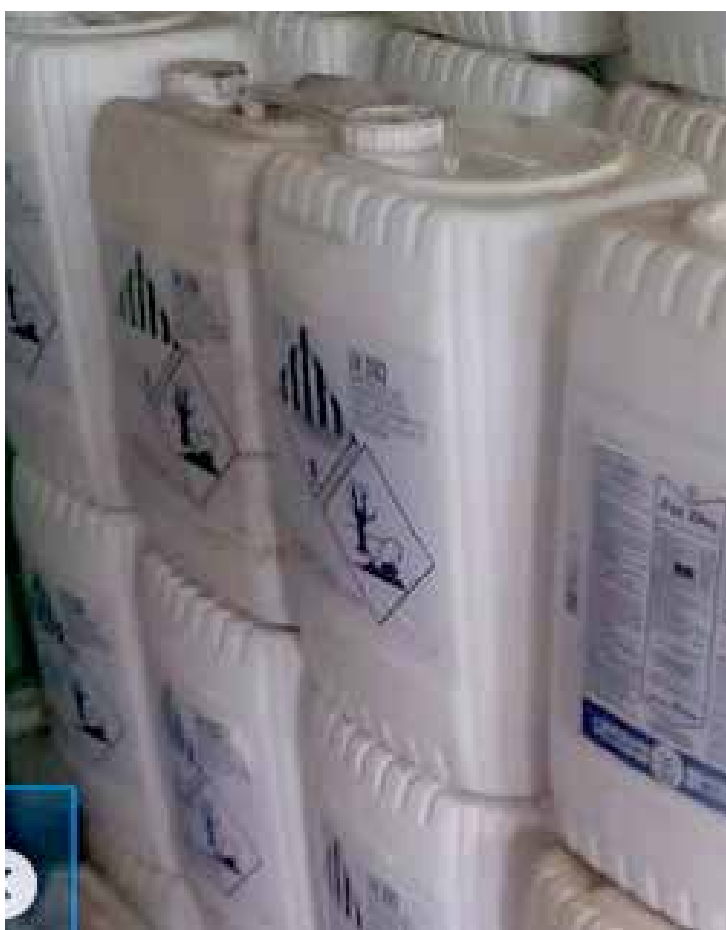
Parte dos defensivos agrícolas furtados.

De acordo com declarações de uma das vítimas, foram furtados 1.300 litros de Fox Xpro (Lote: 0354-21-21120) e 1.340 litros RoundUp Mais, estimados em um valor bastante alto. O que se transformaria em um enorme prejuízo