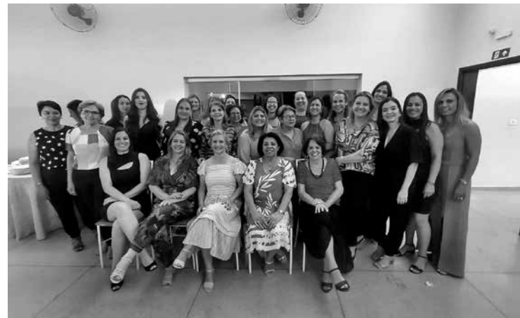
Fraternas presentes na Festiva de Natal

to, onde o que se viu presentes, o que levou o extravasamento da festa até alta madrugada.