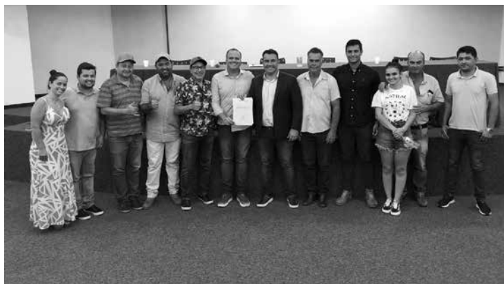
Vereadores presentes à reunião de assinatura da ordem de serviço de Tupaciguara.

Vereadores da Câmara Municipal de Tupaciguara marcaram presença na tarde do dia 04 de janeiro no auditório do Centro Administrativo "Enodes de Oliveira", quando o prefeito Francisco Lourenço Borges Neto, assinou a ordem de serviço para início dos reparos de todas as Unidades Básicas de Saúde