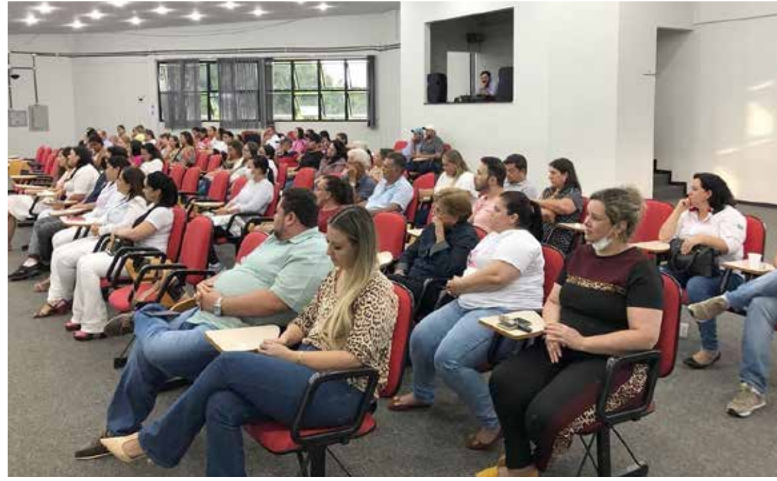
Público presente na assinatura da ordem de serviço para as obras de melhorias nos PSFs de Tupaciguara