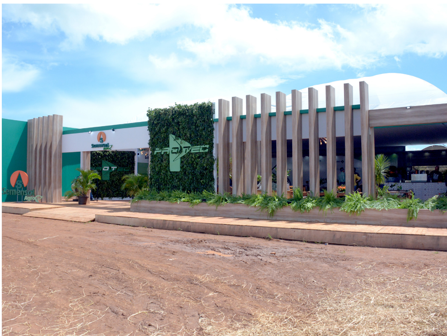
Porta de entrada para o grande evento promovido pela Protec e Semensol (Fachada das instalações do Dia de Campo)

Destaca-se também, nesta grande empresa do agronegócio, o seu time de vendas direta, bem como uma equi-