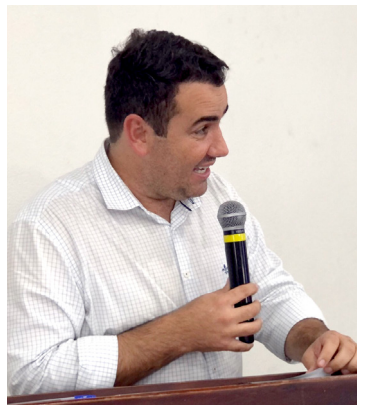
Prefeito Francisco Neto

O que se pode dizer é que o Avança Tupaciguara está em todas as áreas de trabalho da administração municipal, principalmente na saúde que para o prefeito Francisco Neto é prioridade!