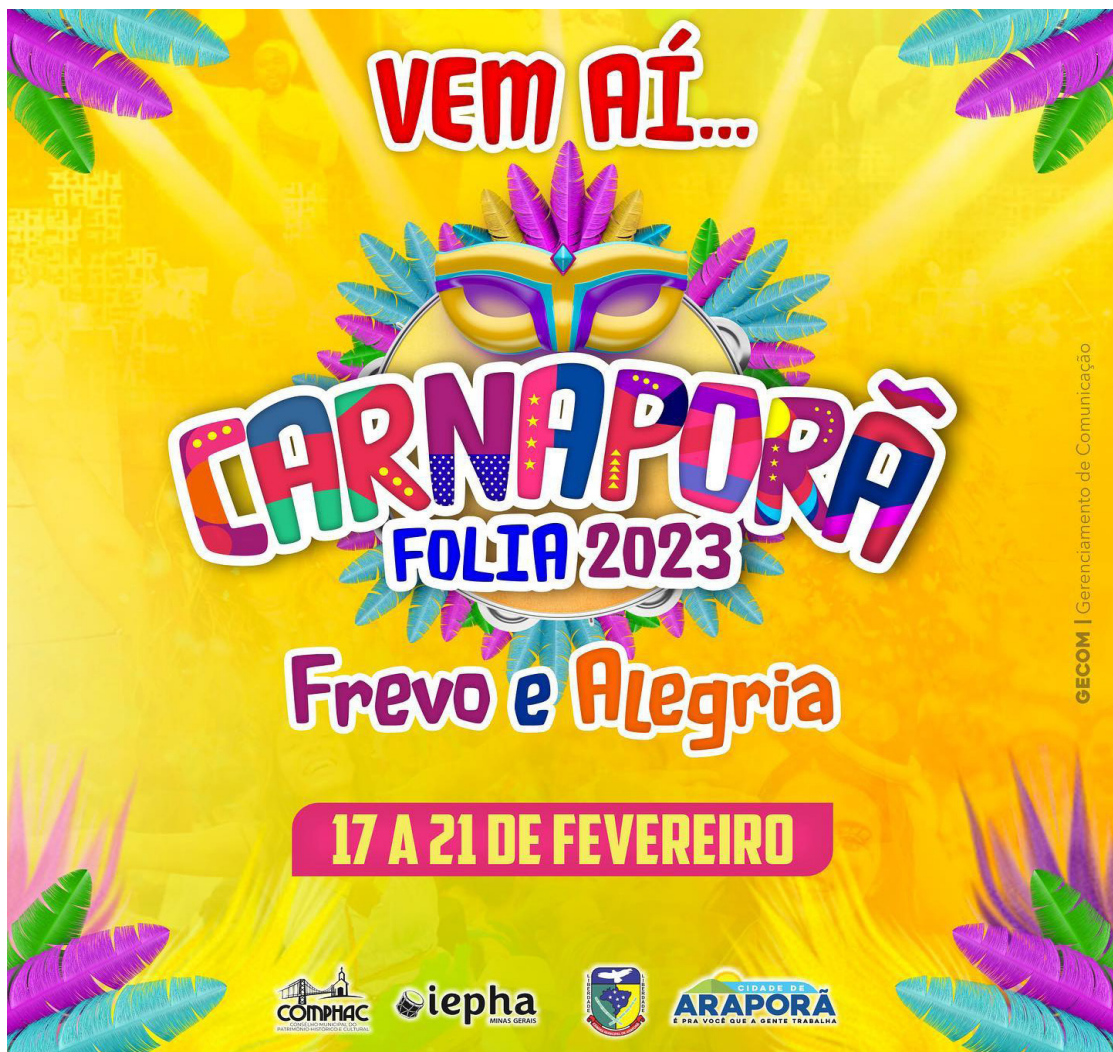
GECOM | Gerenciamento de Comunicação