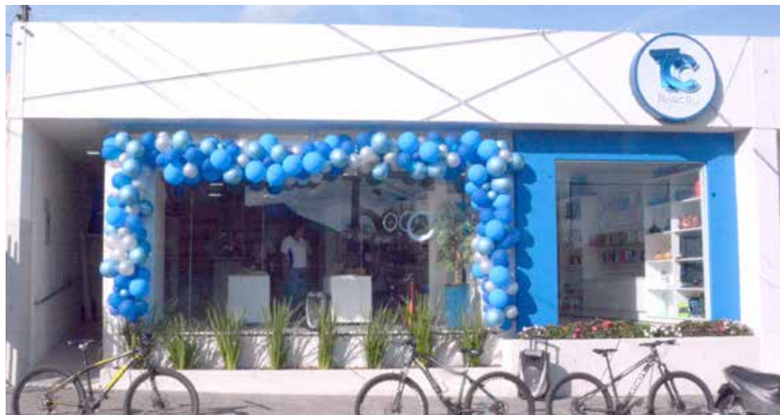
Novo visual da fachada da loja Tellecel da rua Bueno Brandão

As pessoas que estiveram visitando a reabertura da loja foram unânimes em afirmar