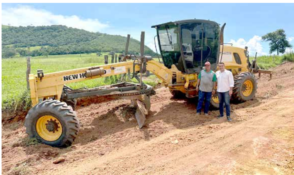
Prefeito Neto vistoriando o trabalho realizado na região do Córrego do Ouro

A secretaria de serviços urbanos em parceria com o DAE estão em trabalho constante para a recuperação das ruas e avenidas de todos os bairros da cidade, bem com o dos distritos do Bálamo e Brilhante. Toda a recuperação é questão de pouco tempo, desde que as condições do tempo permitam a realização desta ação.