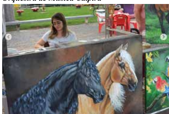
Artesã expando trabalho de pintura