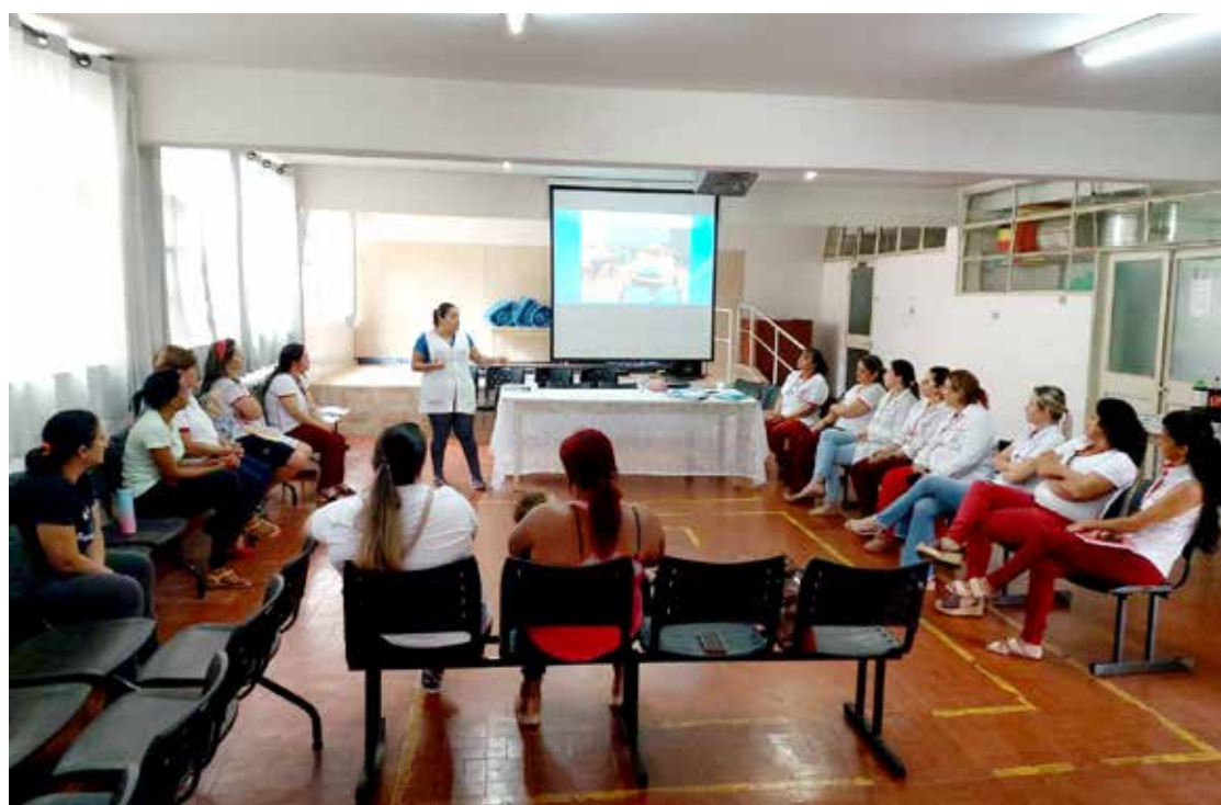
Apresentação do Projeto às Famílias