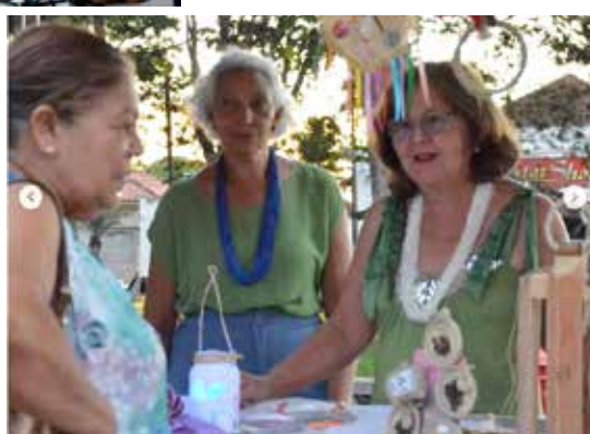
Pessoas adquirindo produtos expostos