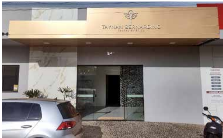
Fachada do Taynan Bernardino - Centro Estético