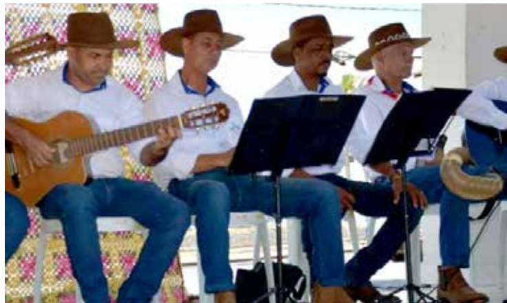
Orquestra de Música Caipira