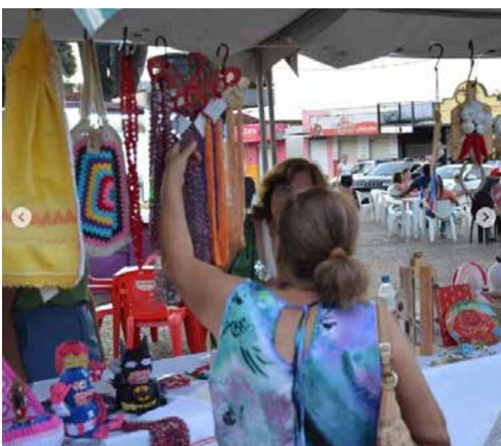
Qualidade dos produtos exposto foi muito elogiada

Além das compras, o público presente pode desfrutar de apresenta-