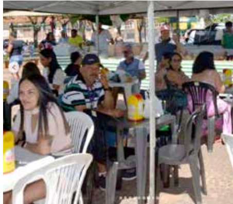
Público curtindo bons momentos na feira