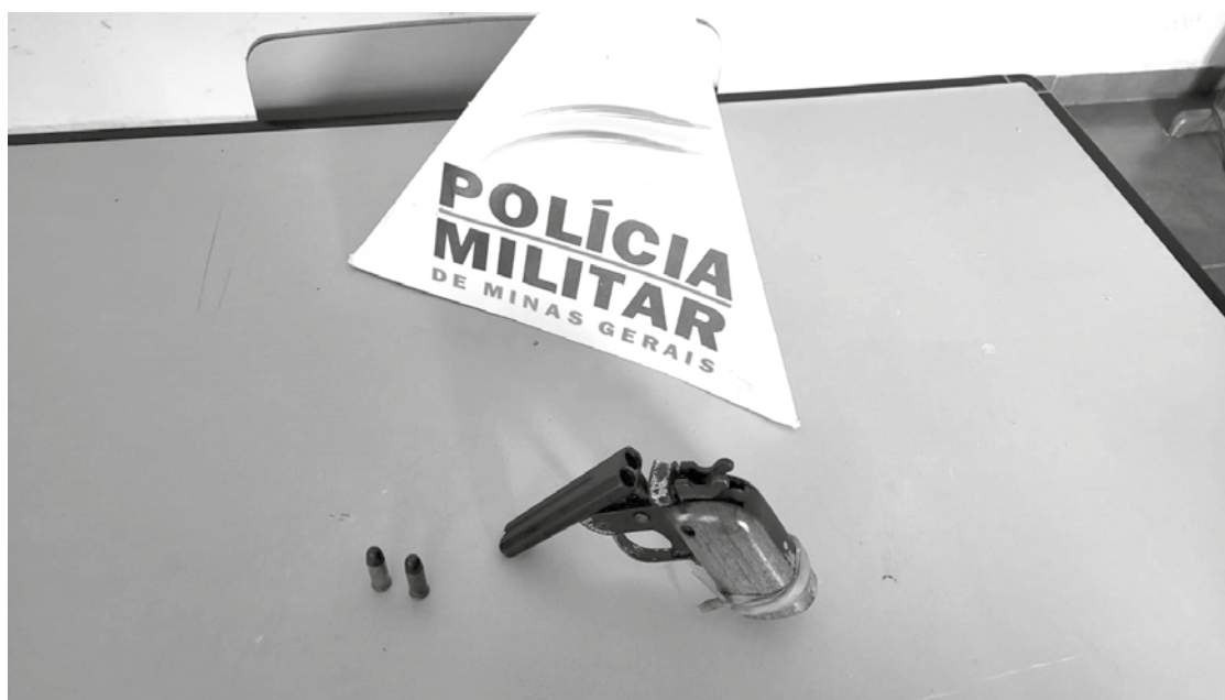
Arma que foi encontrada com D.J.S

Ao se aproximarem do elemento, os policiais notaram que ele havia jogado algo no lote vizinho. Ao darem busca no referido lote os policiais encontra-