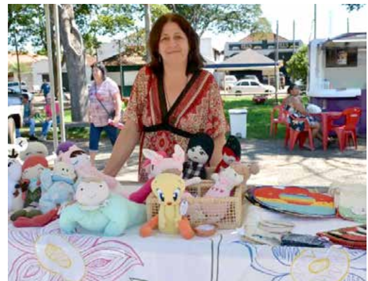
Trabalho artesanal elogiado por todos os visitantes