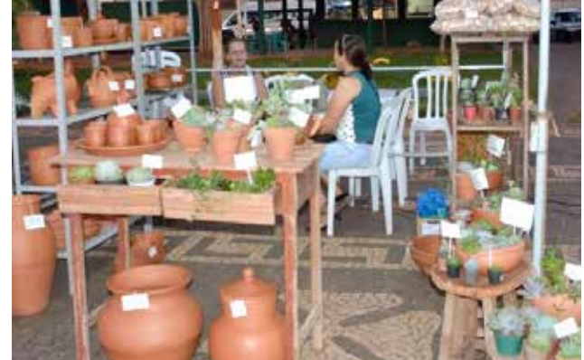
Trabalho artesanal realizado com barro

MÃE, TODO NOSSO AMOR A VOCÊ, QUE NOS DEU O MAIOR PRESENTE. A VIDA.