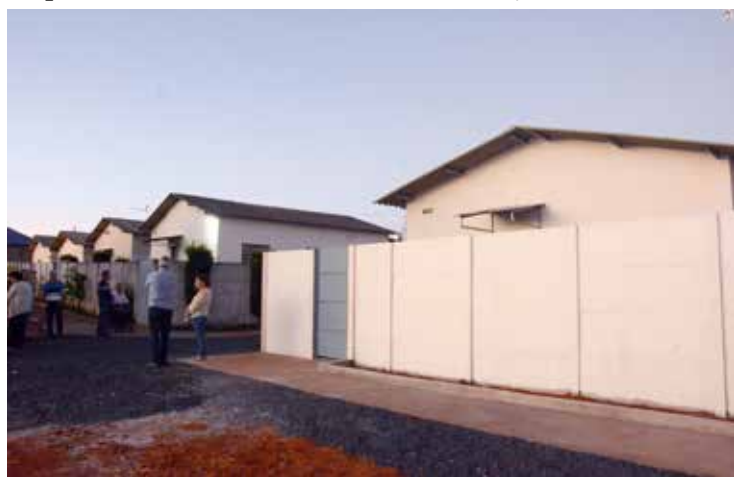
Vista das cinco casas existentes na Vila Maçônica