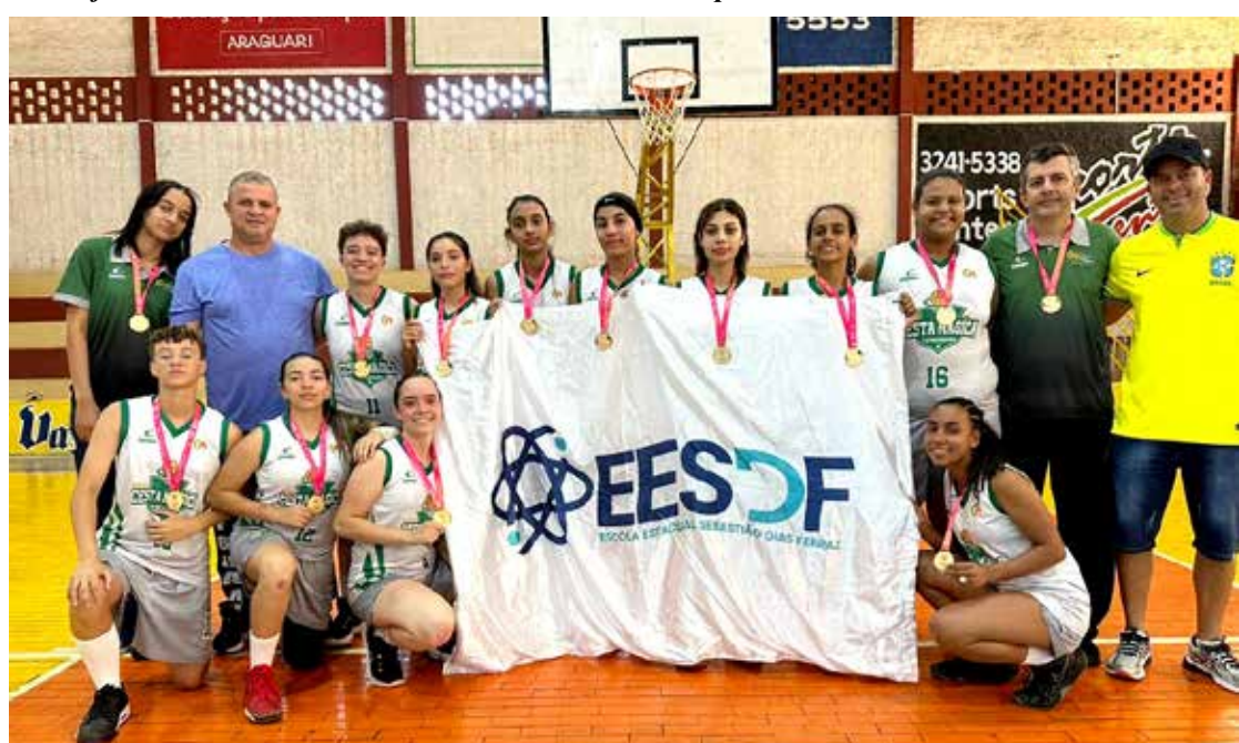
Equipe Cesta Mágica - Campeã no Basquete Feminino módulo II

O BOM USO DA ÁGUA A GENTE ENSINA COM O EXEMPLO.