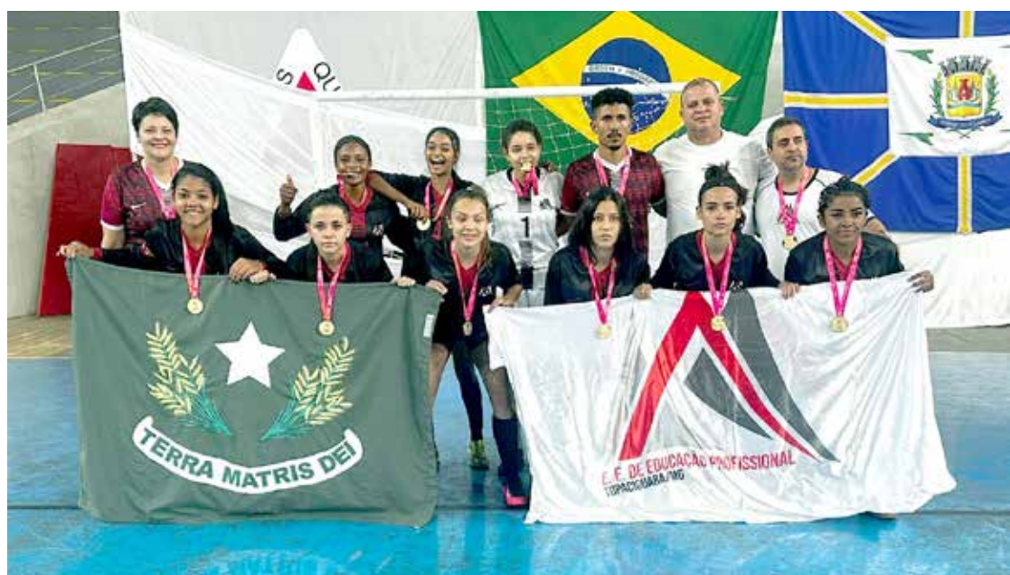
Futsal feminino: Escola Estadual de Ensino Médio - Campeã módulo II