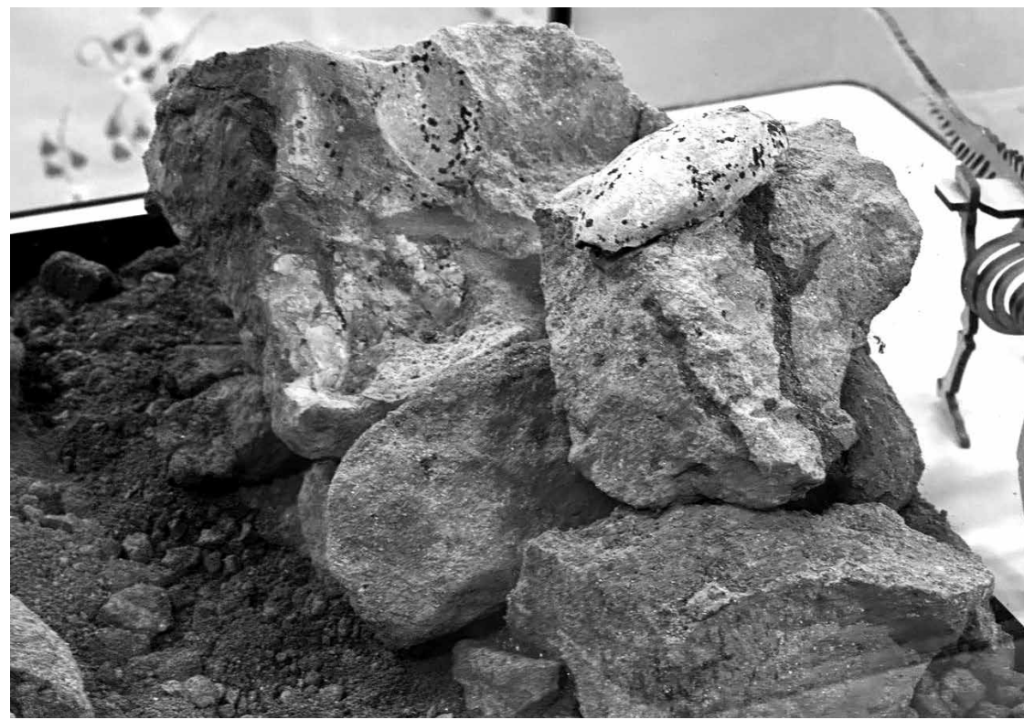
Material encontrado pela Ecovias do Cerrado, quando da construção do trevo sobre as BRs 153 e 365

O fóssil apresenta bom estado de conservação, apesar de ser