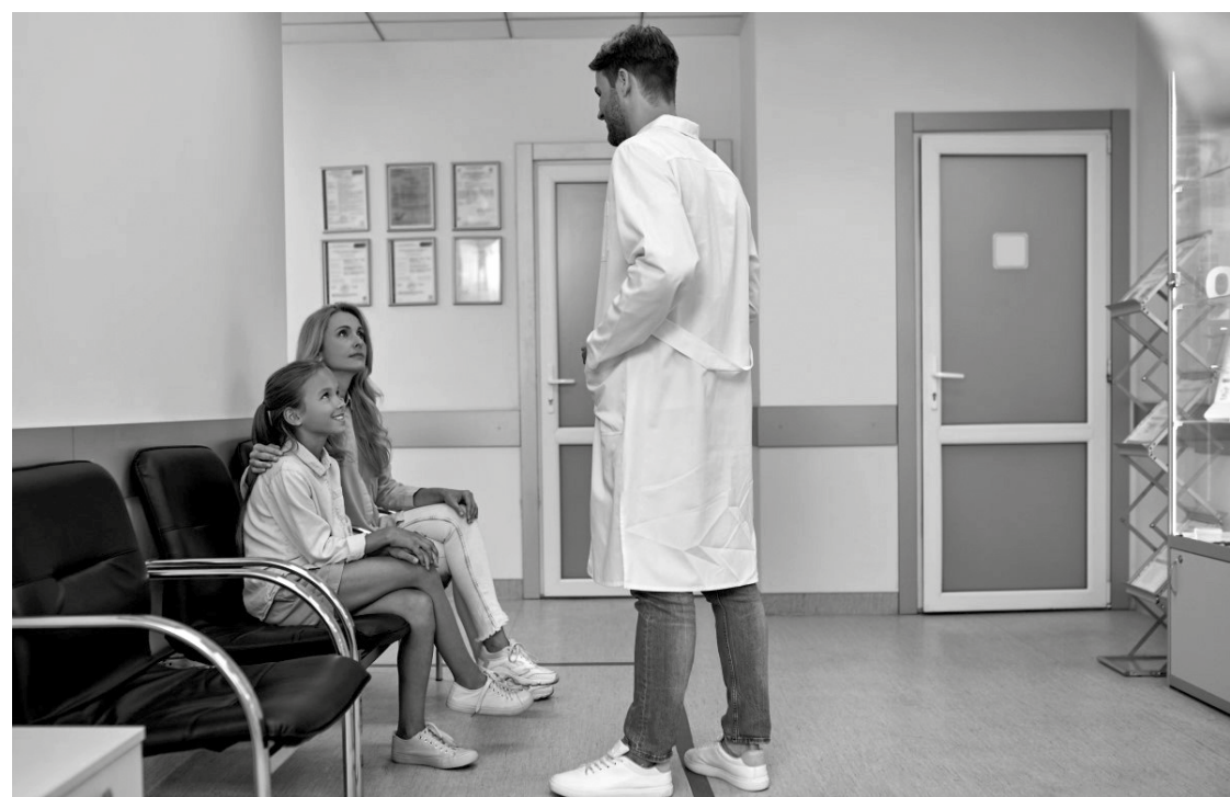
Na primeira consulta, o profissional de saúde poderá abordar temas como puberdade, menstruação, tensão pré-menstrual (TPM) e higiene íntima

Segundo o ginecologista e obstetra Antônio José Chaves, o ideal é que o acompanhamento ginecológico seja iniciado desde a adolescência, de preferência, assim que ocorrer a primeira menstruação. O profissional frisa, ainda, que não é necessário ter vida sexual ativa para procurar esse especialista. "A primeira consulta ao ginecologista é um marco importante para a mulher. É nesse momento que são estabelecidos os cuidados necessários para garantir uma vida saudável, do ponto de vista da saúde