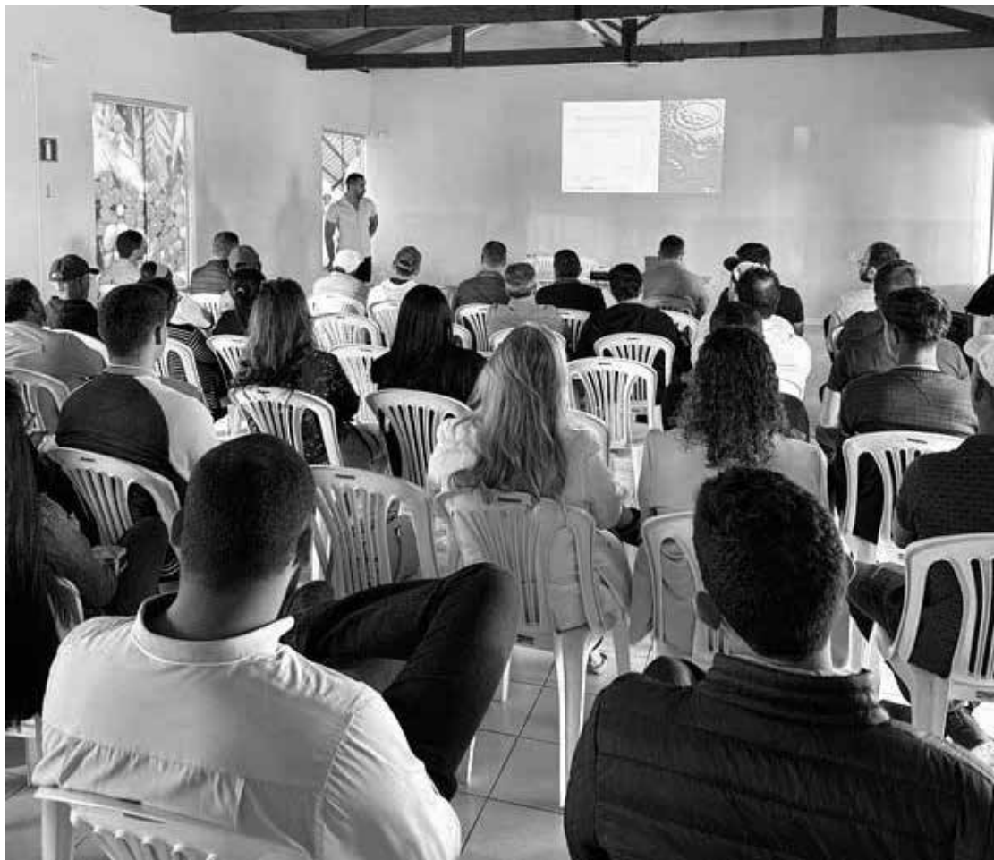
Usuários solicitaram uma palestra presencial para entender passo a passo das obrigações legais sobre a utilização de recursos hídricos

Caso a intervenção não conste na planilha, o usuário deve preencher o Formulário de Débito não localizado 2023. Além das portarias individuais, a Cobrança incide também sobre as outorgas co-